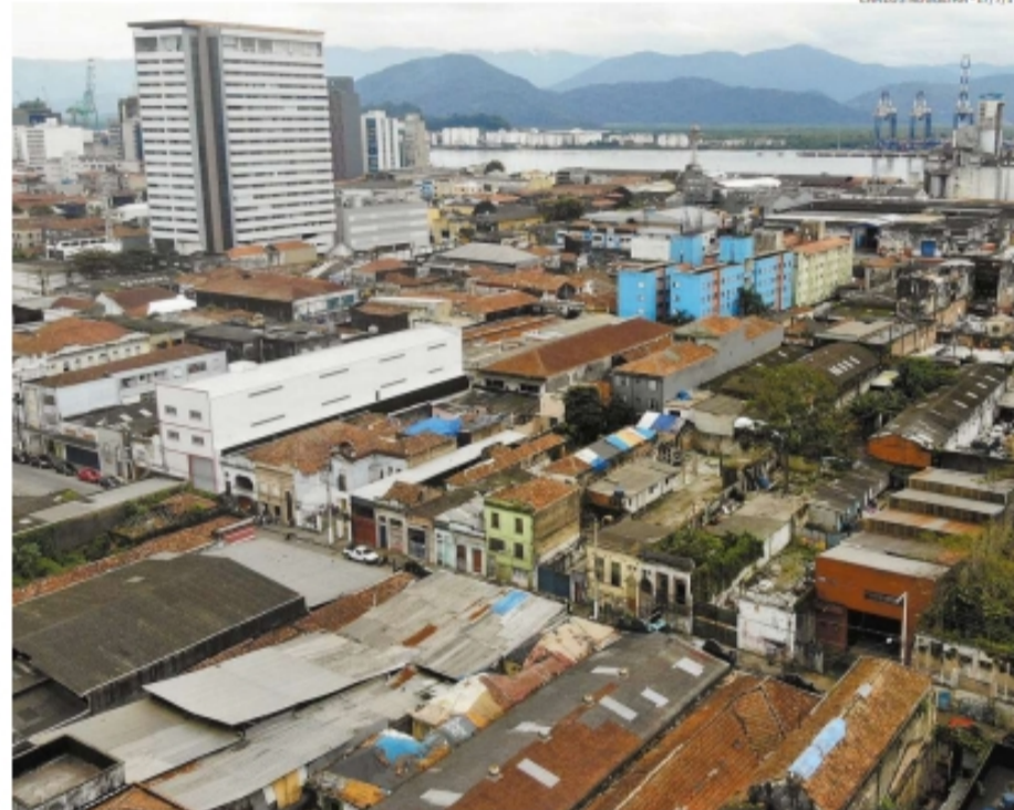
Prefeitura entende que o pacote formado por isenções e descontos em tributos pode mudar o Centro

O projeto deve ser votado e aprovado em segunda discussão na próxima semana. Antes de seguir para a sanção do prefeito, algumas emendas devem ser analisadas, já que muitos vereadores prometeram acrescentar itens ao texto para ampliar os incentivos a mais seguimentos, além de comércio e serviços.