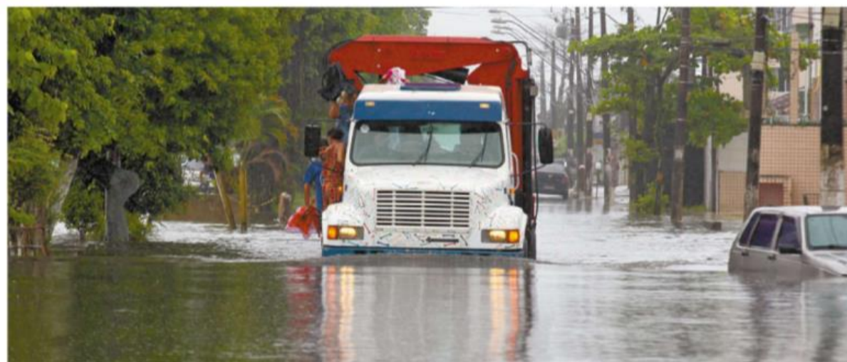
São Vicente também registrou problemas, como na Rua Frei Gaspar. Para chegar a um lugar seguro e seco, pessoas pegaram carona no caminhão que desafiava o alagamento