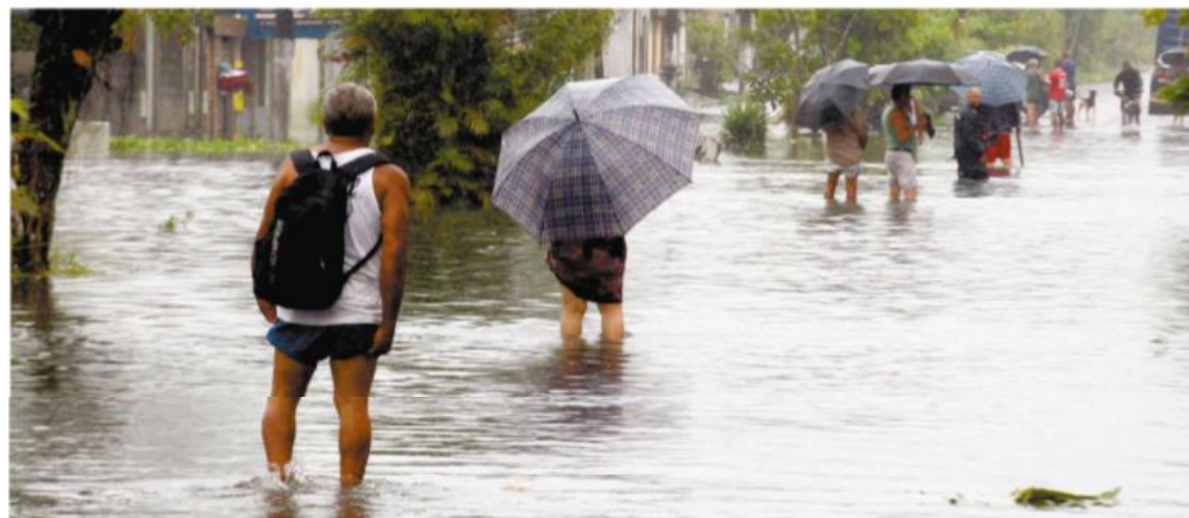
A árdua tarefa de tentar honrar os compromissos: travessia de trecho alagado na Avenida Dom Pedro II, em São Vicente. Além dos inconvenientes, o risco de se contrair doenças