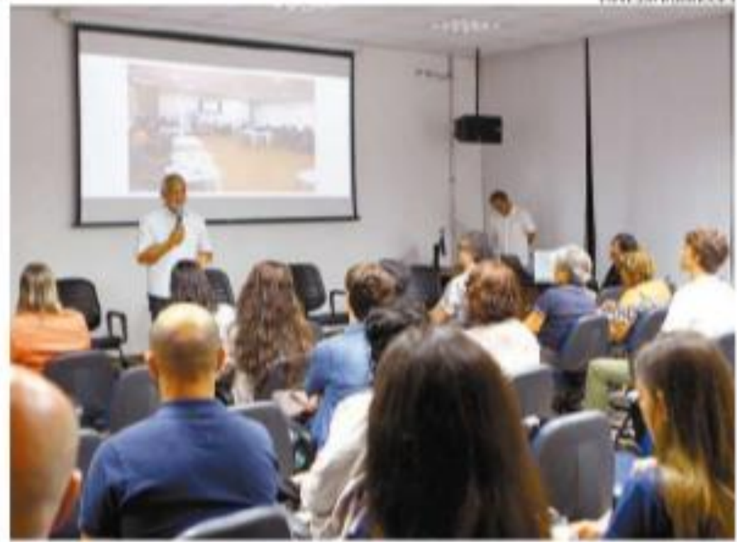
Programa prévio foi apresentado ontem, durante encontro no Sesc

O secretário aponta que, no debate, houve avanço importante no mapeamento de serviços e áreas de ação, como cursos de água originais, para “entender como