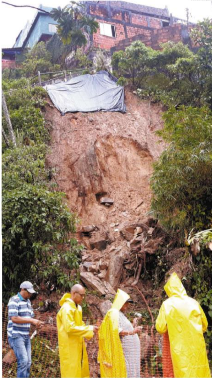
Técnicos avaliam um trecho de encosta no Morro do São Bento: chuva de 2ª-feira causou deslizamento