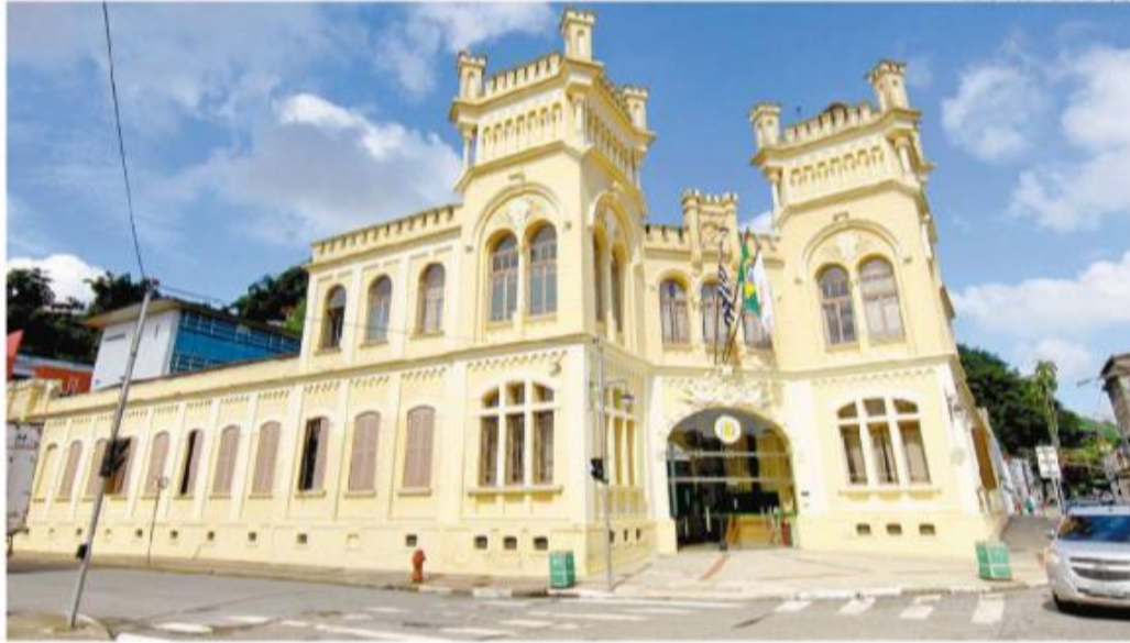
Na Câmara dos Vereadores de Santos estão disponíveis 35 vagas, e as inscrições vão até o dia 5 de março

Contudo, três processos seletivos encerram as inscrições nesta semana. Entre as oportunidades na reta final está o concurso da Força Aérea Brasileira (FAB), com 150 chances em sete postos e cujas inscrições