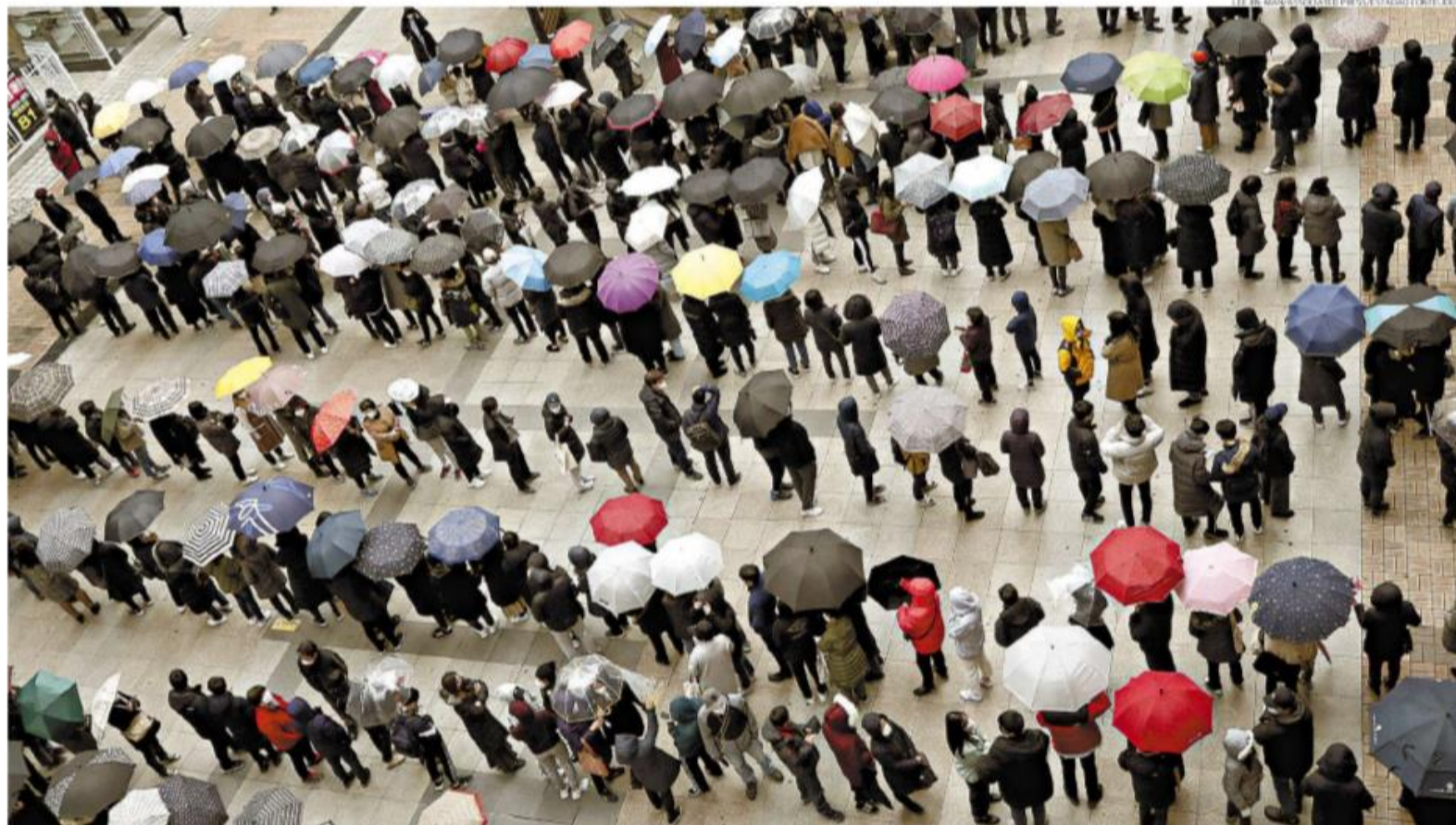
Pessoas enfrentam longa fila para comprar máscaras do lado de fora de uma loja em Seul, na Coreia do Sul. O governo divulgou ontem 571 novos casos de coronavírus: total de infectados no país chega a 2.337

Álvaro, em Santos, reservaram 41 leitos para esse tipo de atendimento, conforme orientação da Secretaria Estadual de Saúde. A-3 E A-4