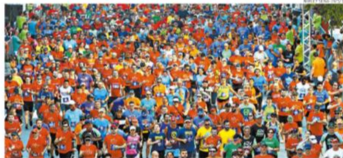
A 35ª edição da festa do pedestrianismo da Baixada Santista já tem data para acontecer: dia 17 de maio

Página C-3 Real Madrid e Barcelona se enfrentam hoje