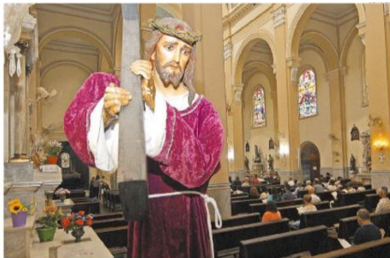
Ainda não há orientação sobre aperto de mãos e gestuais de saudação durante as missas católicas