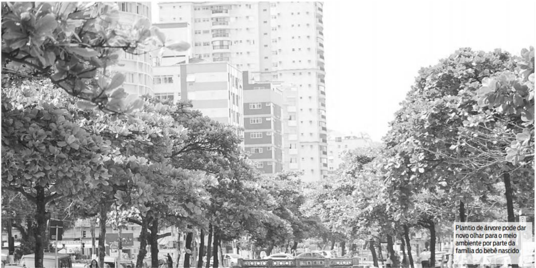
Plantio de árvore pode dar novo olhar para o meio ambiente por parte da família do bebê nascido