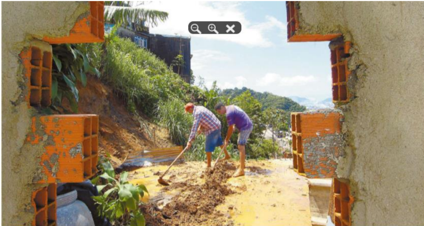
No Morro do São Bento, em Santos, uma cena comum entre a vizinhança: após os deslizamentos, moradores limpavam os terrenos de suas casas em meio ao cenário de destruição