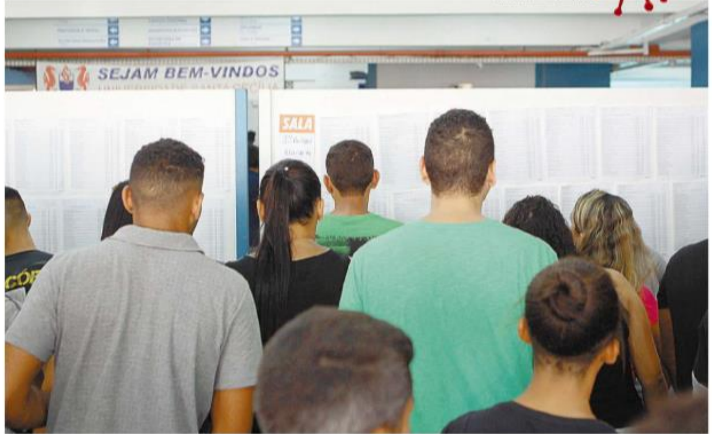
Seis concursos foram suspensos na Baixada Santista, por causa do coronavírus; dois deles, em Santos e Itanhaém, teriam provas domingo

A Prefeitura de Praia Grande, que tem 22 vagas para médicos pediatras de Pronto-Socorro e atendentes de educação, também não respondeu se vai suspender o exame, que está marcado para este domingo – até o fechamento desta edição não havia nenhuma informação no portal da Cidade.