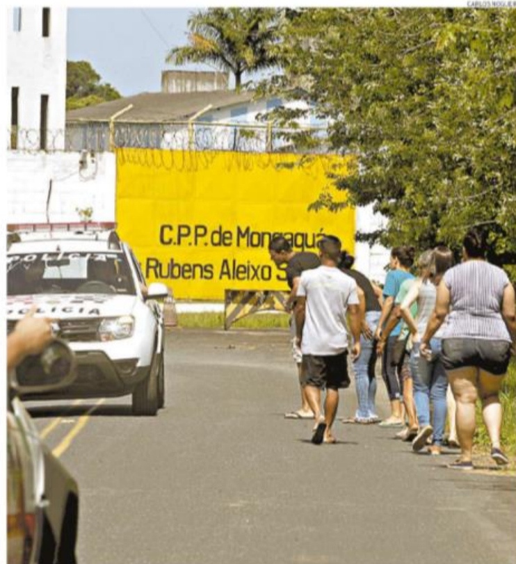
Ontem, era intensa a mobilização de policiais no CPP; familiares buscavam informações sobre os detentos

Precaução. C-2 Copa América e Eurocopa são transferidas para 2021