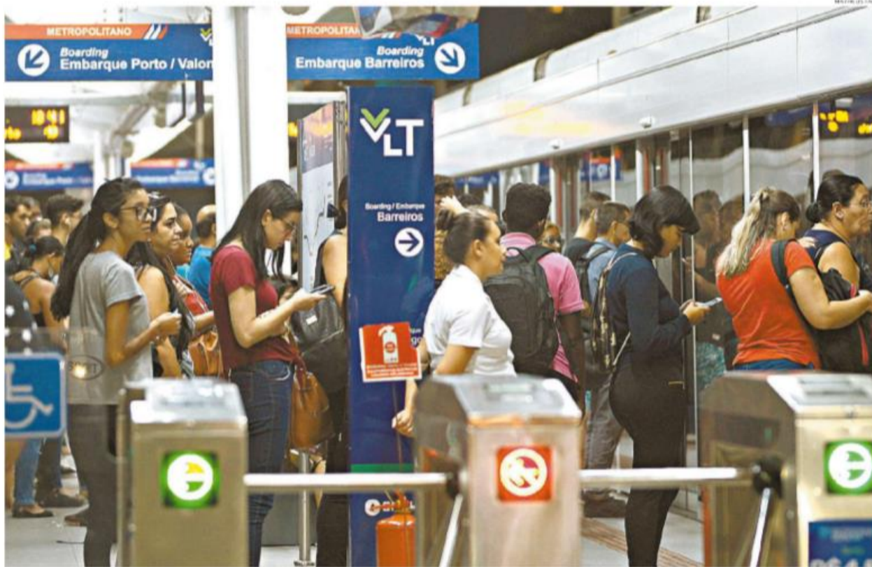
Com o retorno do trabalho, estação do VLT na esquina das avenidas Francisco Glicério e Ana Costa ficou lotada por volta das 18h40 de ontem: cidades podem ampliar restrições

grafia e Estatística (IBGE) adiou o Censo programado para este ano. E as provas do órgão serão transferidas para 2021. A-2 (EDITORIAL) A A-6