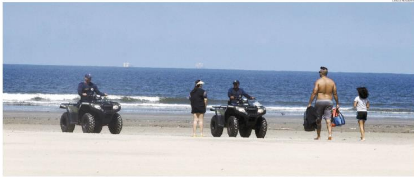
Uma família da Capital foi flagrada na Praia do Gonzaga, em Santos, ontem pela manhã. Eles chegaram até o mar, mas acabaram abordados por uma equipe da Guarda Municipal: disseram não saber da proibição