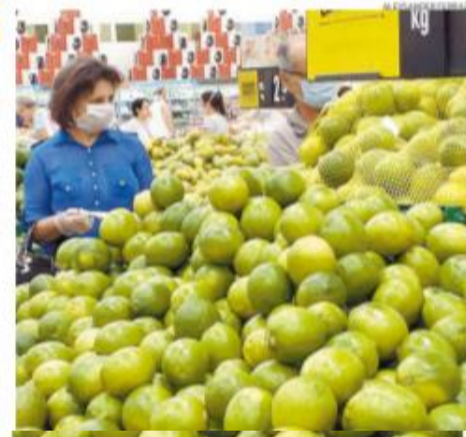
Antes de ir ao supermercado, veja cuidados básicos nesta época. A-7

➤ Fim da quarentena estadual, dia 7, não garante reabertura do comércio. Cenário será reavaliado. A-3