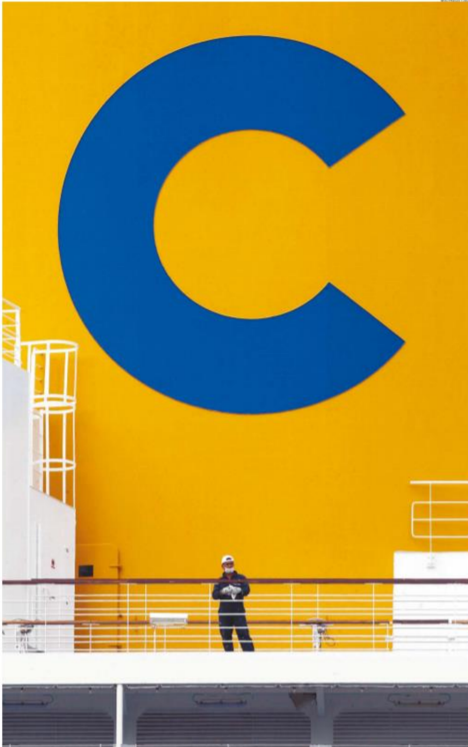
O transatlântico Costa Fascinosa se mantém no cais santista. Houve a confirmação de coronavírus em 2 tripulantes estrangeiros do navio. A-10