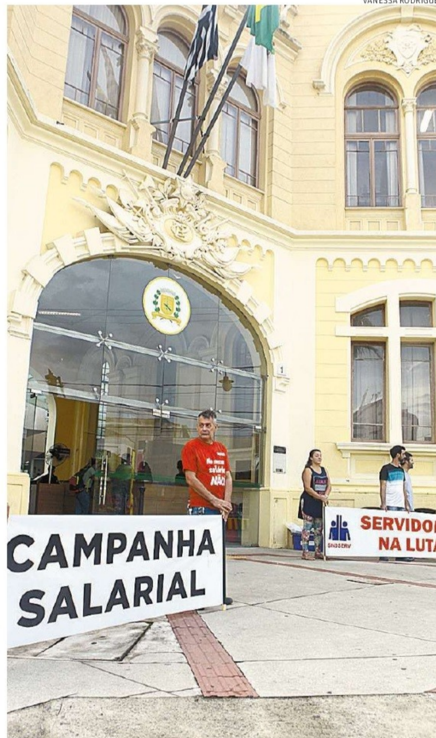
Sindserv promoveu um ato na porta do Legislativo antes da votação