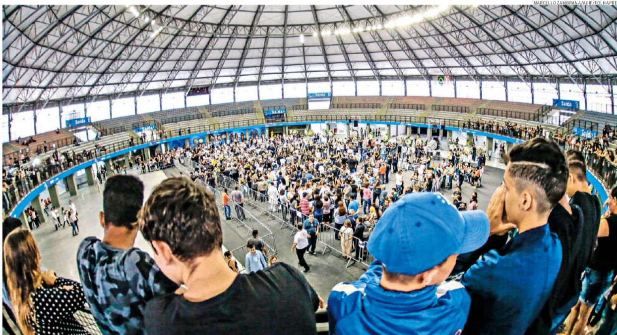
Velório coletivo de duas funcionárias e cinco dos seis alunos da escola estadual teve mais de 15 mil pessoas, que formaram filas e chegaram até em ônibus escolares à Arena Suzano

novatos: Professor Kenny (PP) e Tenente Coimbra (PSL). O quarteto deverá reforçar as demandas relacionadas à região. Educação, saúde e segurança também estarão entre as prioridades, prometem. A-3