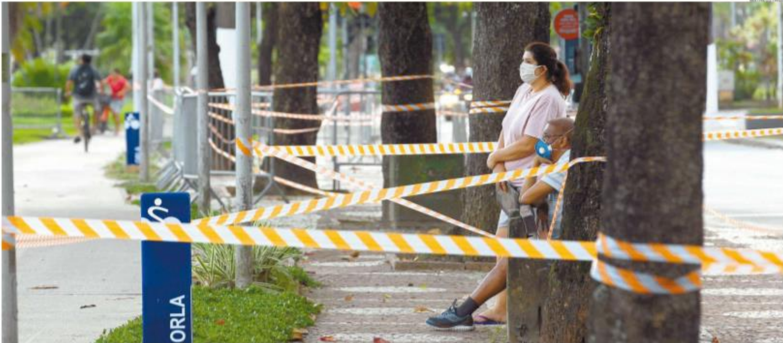
A Baixada Santista manterá a quarentena conforme a prorrogação determinada pelo Governo do Estado: pelo menos até 22 de abril. Em Santos, os passeios pelo calçadão da orla estão proibidos até domingo