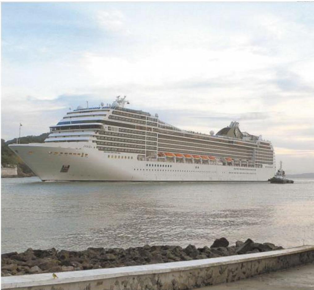
Enquanto o navio Poesia (foto) entrava no Porto para reabastecer, o Costa Fascinosa foi autorizado pela Anvisa a deixar o cais para manutenção