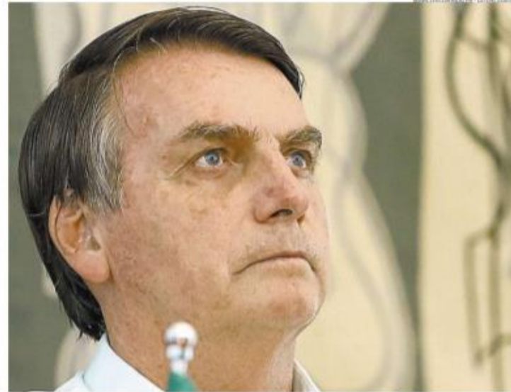
O agora ex-ministro se despediu dos funcionários da pasta com um discurso emocionado. Depois de apresentar o novo titular da Saúde, Bolsonaro criticou o presidente da Câmara, Rodrigo Maia