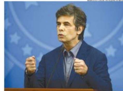
Nelson Teich afirmou ter “alinhamento completo” com o presidente

Depois de semanas de desavenças, o presidente Jair Bolsonaro demitiu ontem o ministro da Saúde, Luiz Henrique Mandetta, e anunciou o oncologista Nelson Teich como novo titular da pasta. A divergência estava na diretriz das políticas públicas de combate ao novo coronavírus. Mandetta foi exonerado 49 dias após o registro do primeiro caso de covid-19 no País. Depois da demissão, Bolsonaro confrontou o presidente da Câmara, Rodrigo Maia (DEM-RJ), insinuando que o parlamentar trama contra o seu governo. A-5