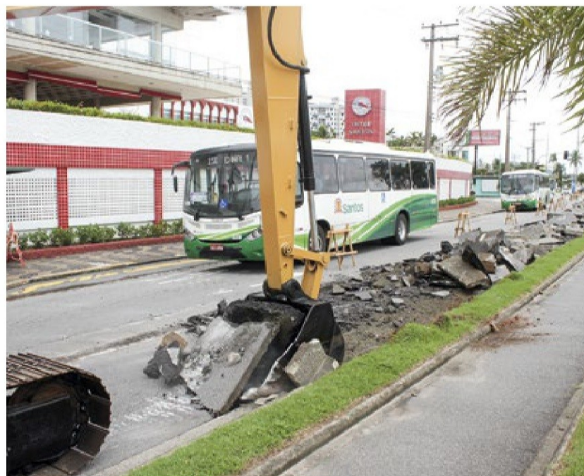
Conforme a ação, serão necessárias medidas mitigatórias e eliminação dos impactos de vizinhança

Caso a Justiça conceda a liminar, as obras devem ser suspensas e o viário reposto em 30 dias, sob pena de multa diária de R$ 50 mil