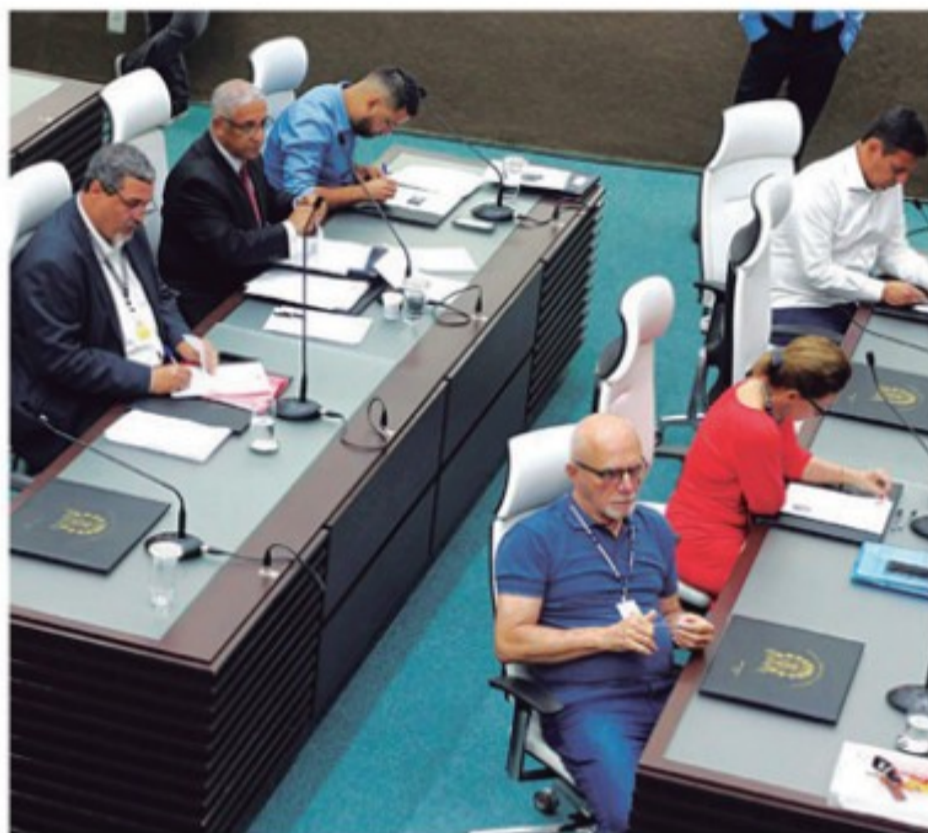
Vereadores aprovaram proposta apresentada pelo Executivo

Entre os dois sindicatos de servidores havia divergência sobre o tema. O Sindicato dos Servidores Estatutários, que reúne a maioria dos funcionários, já havia aceitado a proposta em Assembleia, mas o Sindicato dos Servidores Públicos Municipais defendia um reajuste de 5% e chegou a realizar uma pequena manifestação na porta da câmara. Mas o projeto foi aprovado em clima tranquilo.