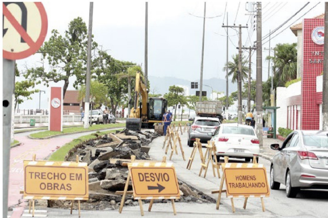
Os serviços incluem mudança de posição do canteiro central, alargamento do calçamento e construção da nova ciclovia

Além de anular os termos e suspender as obras, a liminar prevê outras ações, como a suspensão das contrapartidas, a implantação de medidas necessárias à mitigação