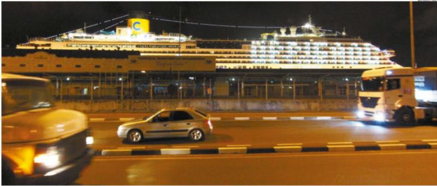
A tripulação do Costa Fascinosa agradeceu pelos cuidados em Santos com os marítimos infectados por covid-19 que seguem internados em hospitais da Cidade e a bordo: no navio, um "obrigado" com luzes. A-12