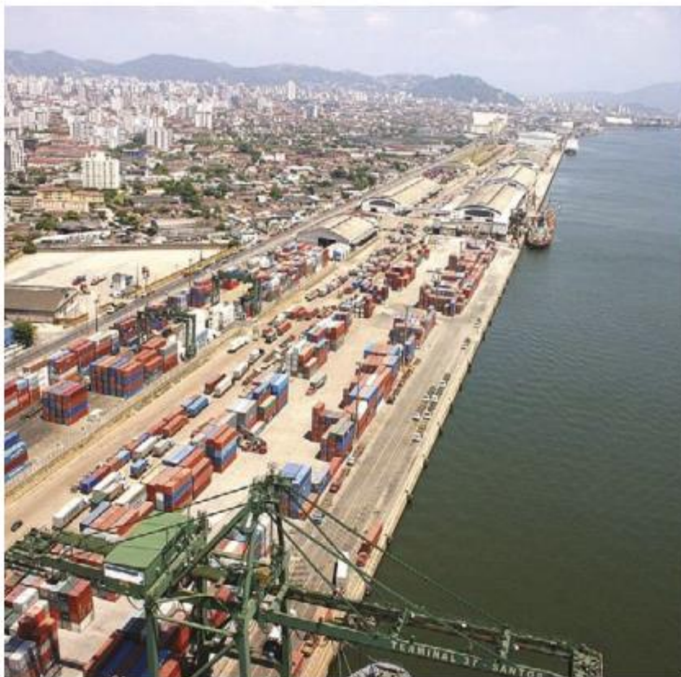
SPA prevê aumento de 50% da capacidade de movimentação de cargas pelos próximos 20 anos, gerando emprego e renda

A SPA garante ainda que o Porto conta com quatro terminais marítimos e outros retroportuários para contêineres capazes de abarcar com folga a demanda de armazenamento da Marimex e aposta que o novo Plano de Desenvolvimento e Zoneamento (PDZ) – que já deu