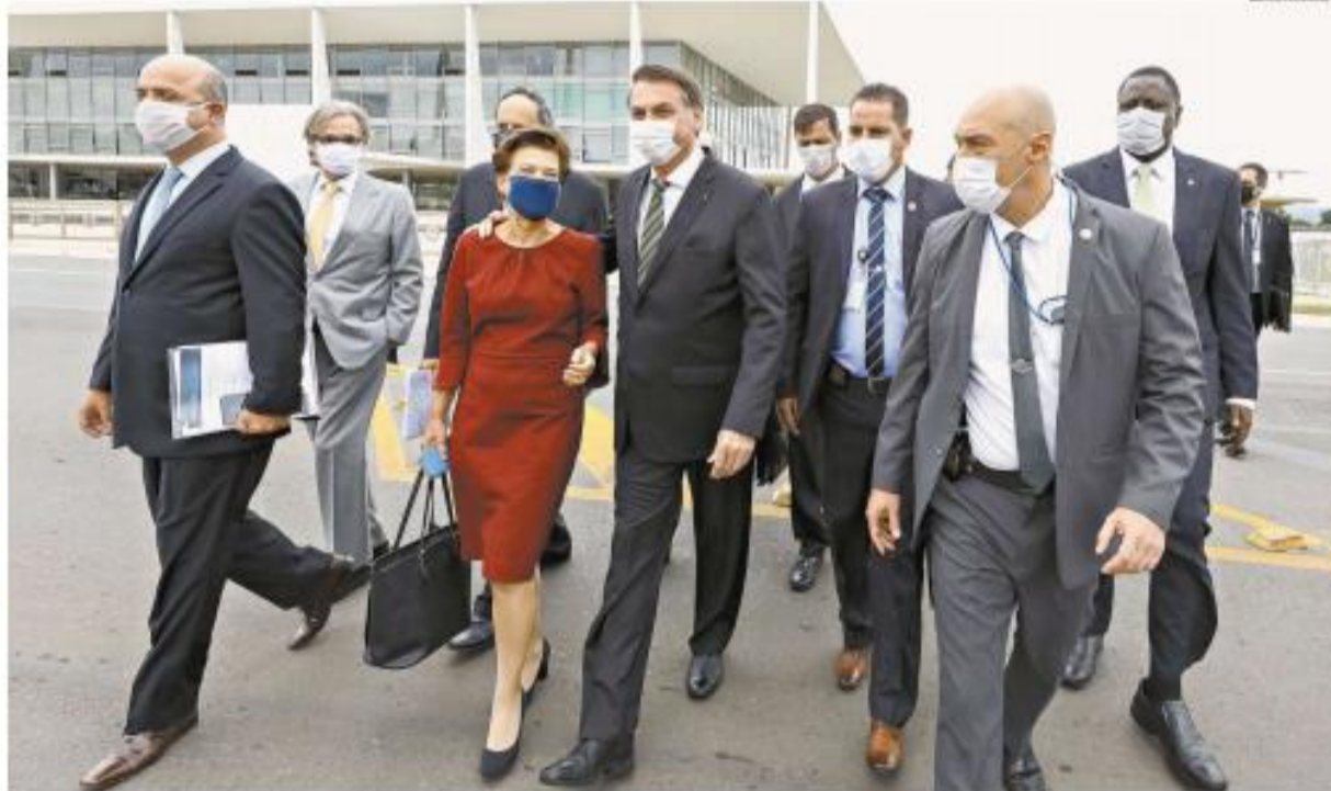
Presidente liderou comitiva durante a ida à sede do Supremo Tribunal Federal: pressão para que o presidente da Corte, Dias Toffoli, amenizasse as medidas de isolamento? A-4

LOYOLA BRANDÃO Nessa quarentena, tem gente pirando, perdendo o controle. C-2