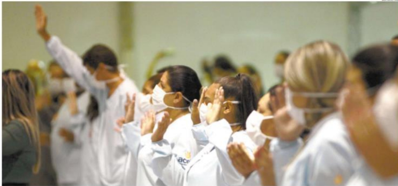
Clima de emoção deu o tom na inauguração do Hospital de Campanha de Guarujá: pessoas que estarão na linha de frente do atendimento emergencial reforçam lado profissional e preocupação com a família