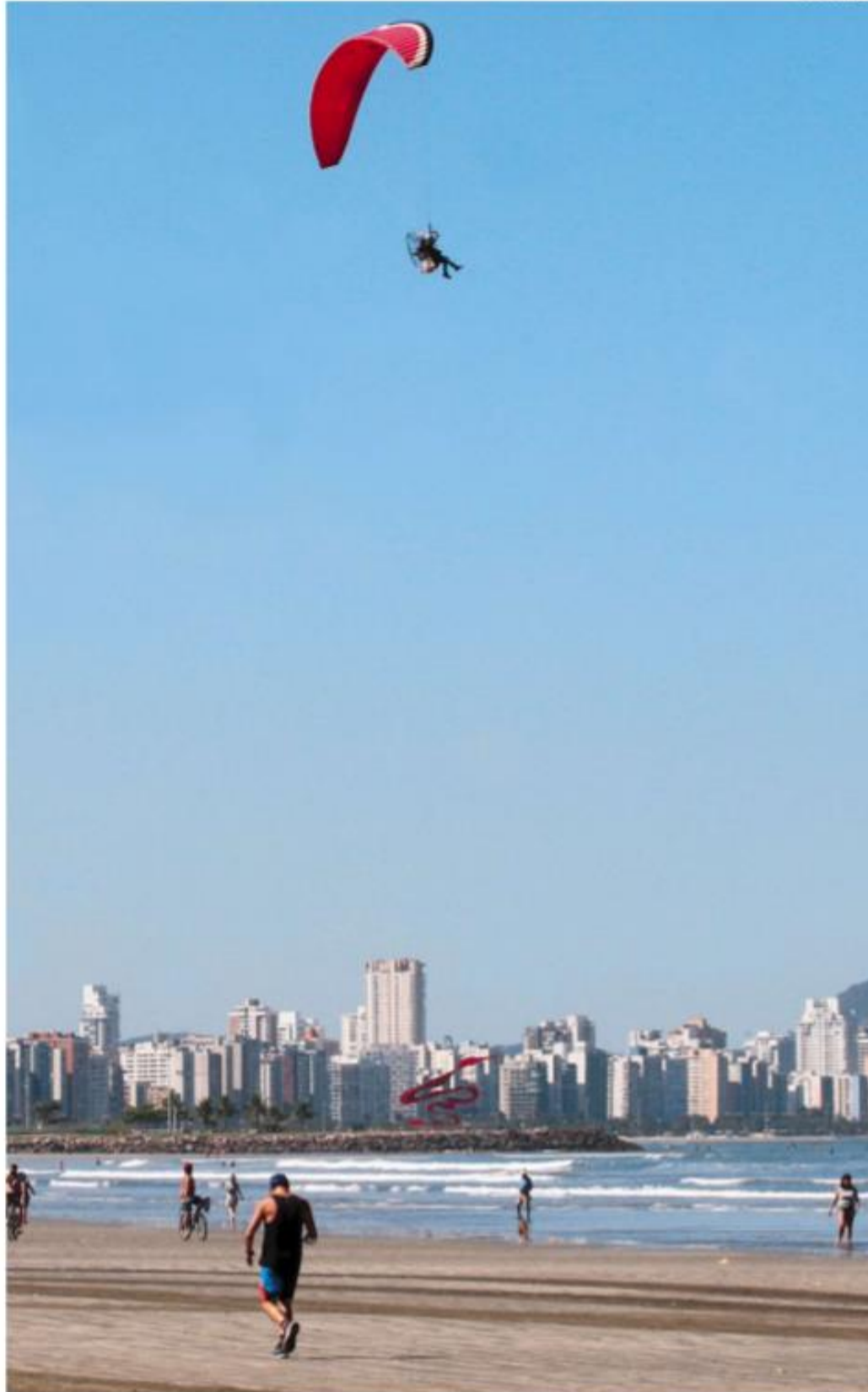
Na manhã de ontem, pessoas caminhavam pela areia da Praia do Itararé, em São Vicente. Mas havia surfistas e praticantes de paragliding