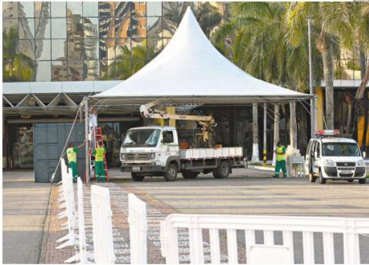
A Prefeitura finalizou ontem o centro de testes para covid-19, no Mendes Convention Center, na Avenida Francisco Glicério. Os exames serão realizados no estacionamento

foram curadas da covid-19 na Baixada Santista. No entanto, 195 morreram. Em termos nacionais, o País tem 177.589 casos confirmados e 882 mortes registradas em 24 horas. O Brasil é 7º em casos normandos e 6º, em número de óbitos (12.400).