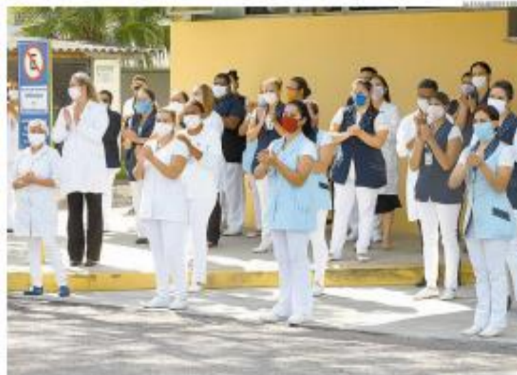
Enfermeiros da Santa Casa recebem homenagem no dia da categoria; em São Vicente, grupo fez protesto