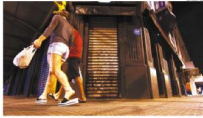
Setores do comércio seguem fechados à espera de novas normas. Estado deve detalhar plano hoje

Baixada Santista. A quantidade a ser enviada à região, porém, não estava definida até o fechamento desta edição. Foram pedidos 137 respiradores. A-4