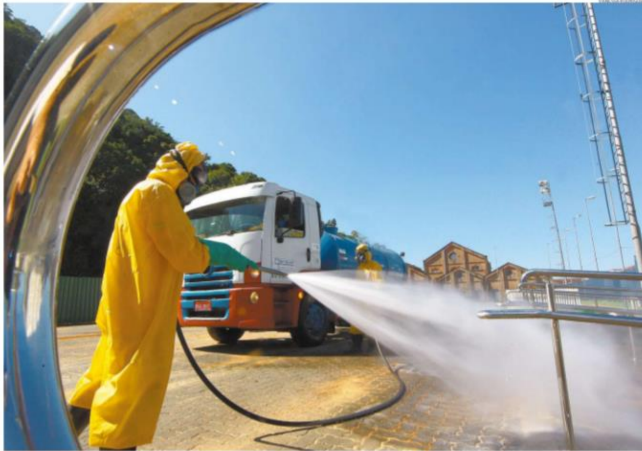
Com a pandemia, água de reúso ganhou outro papel importante: a desinfecção de ruas. Segundo a Sabesp, a necessidade de se evitar a transmissão do vírus ampliou a operação

Que o empresariado continue apostando em seus negócios. A-12