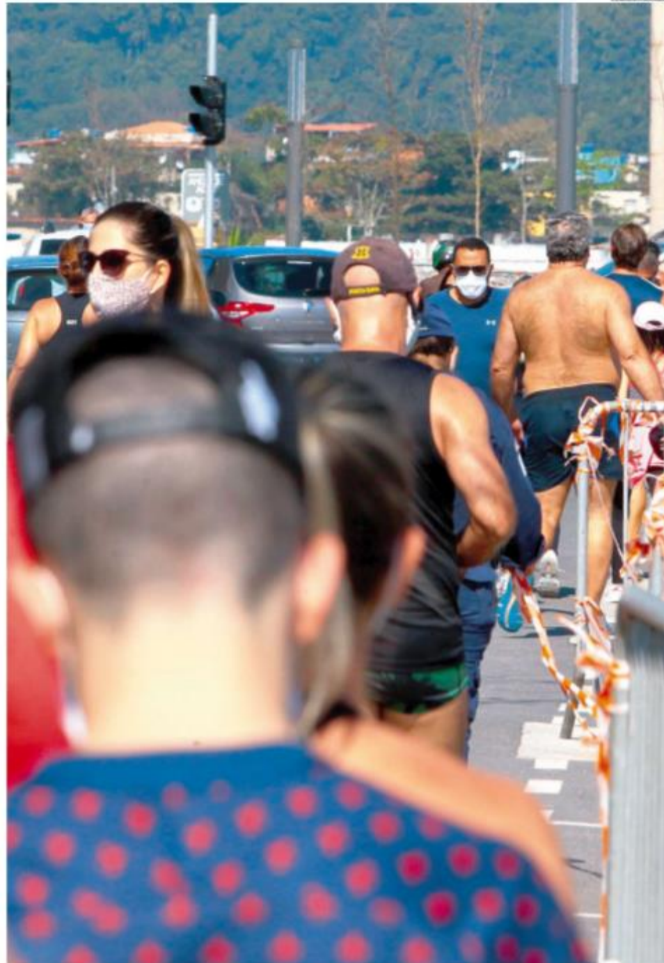
Prefeito criticou o passeio pelo calçadão da praia: "Estou decepcionado... várias pessoas nas ruas circulando como se o mundo tivesse normal"