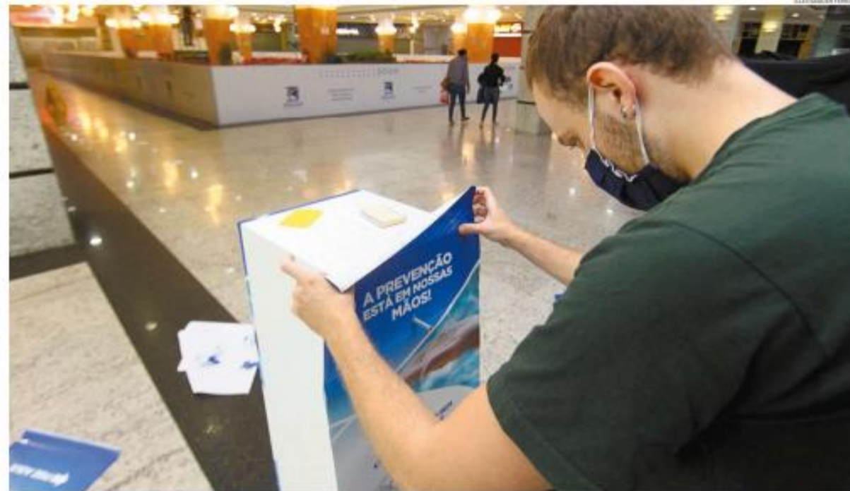
São Vicente inicia hoje a segunda etapa da flexibilização das suas atividades. Com isso, o Brisamar será o primeiro shopping a reabrir as portas na Baixada Santista, das 12 às 18h

O astrólogo e professor Olavo de Carvalho, guru de Jair Bolsonaro na campanha presidencial, postou vídeo em que diz que tem como derrubar o governo. A ameaça se deve a atual desafeito, por falta de apoio em processos judiciais que se encontram em andamento. B-4