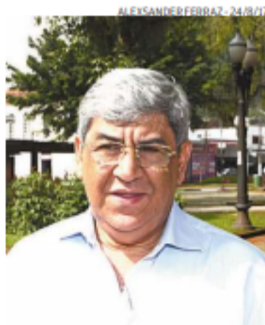
ALEXSANDERFERREIRA - 24/8/17

O parlamentar apelou à Justiça, após ter sido impedido de entrar no complexo de saúde para apurar eventuais irregularidades na contratação de equipamentos para o combate à covid-19.