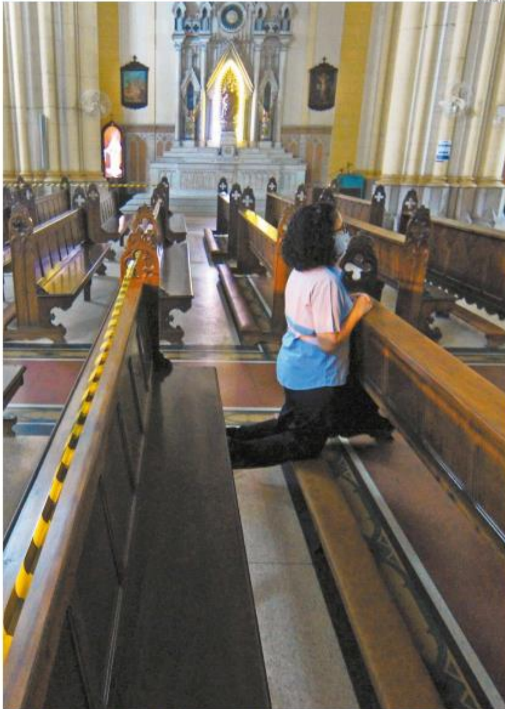
Pela liminar, e agora com o novo decreto, igrejas também terão que fechar as portas. Administração Municipal vê equívocos no texto do TJ