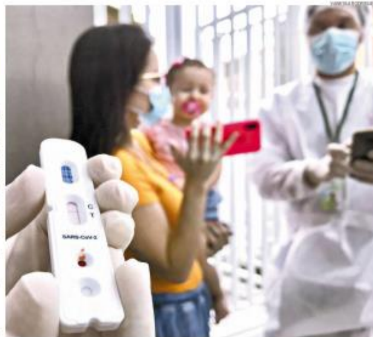
Pesquisadores realizam teste em condomínio de Santos: na Cidade, os exames podem ser prorrogados

Identificados e com equipamentos de proteção, os pesquisadores vão às casas dos voluntários, selecionados de forma aleatória, por sistema computadorizado. Nas quatro etapas do projeto regional, terão sido realizados 10 mil testes rápidos.