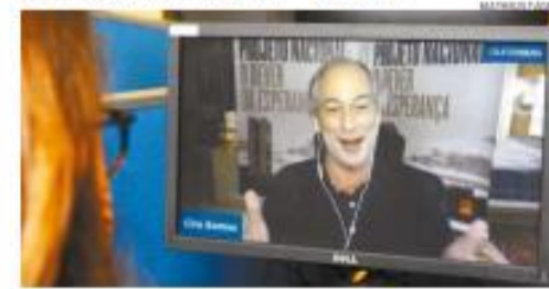
Ele participou da live Sem Censura, promovida pelo Grupo Tribuna

Para ele, o presidente da República precisa ter um projeto claro de desenvolvimento, o que não seria o caso da gestão de Jair Bolsonaro . A-6