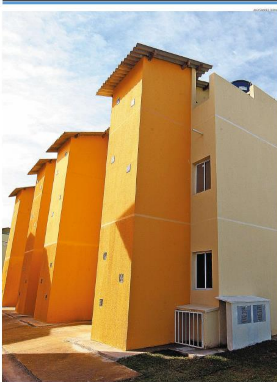
Após 14 anos de uma obra inacabada, Conjunto Parque da Montanha, na Vila Edna, em Guarujá, começou a ser entregue aos moradores. A-6