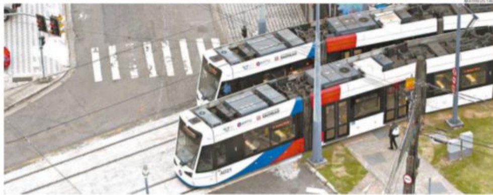
Já está em operação a primeira fase, da Ponte dos Barreiros, em São Vicente, ao Porto de Santos

oito quilômetros e a construção de edificações, urbanização, subestações, sistema de rede aérea e sinalização viária. A-3