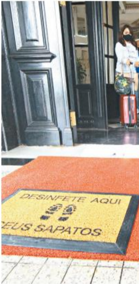
HOTÉIS. Com 30% a 40% de sua capacidade, os hotéis e pousadas da região já estão abrindo as portas aos turistas, mas com cautela. Dos 32 mil leitos disponíveis na Baixada Santista, cerca de 12 mil devem estar disponíveis a esse público. Algumas pousadas, segundo o presidente do sindicato do setor, nem devem abrir neste momento, por entenderem que ainda é prematuro o funcionamento. A-3