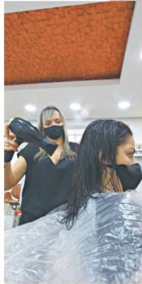
SALÕES DE BELEZA. Os salões de beleza de Santos voltaram a receber clientes, em nova configuração: há menos pessoas nos ambientes e os espaços estão adaptados para manter o respeito ao distanciamento social e à higienização adequada. O público celebra a possibilidade de "dar um trato" na aparência, enquanto infectologistas reforçam a necessidade de atenção. A-5

Motor No mundo virtual, união é real e faz a força