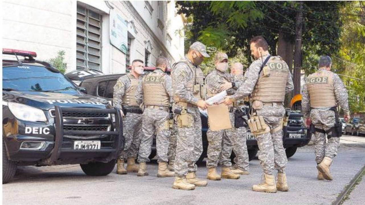
O Grupo de Atuação Especial para Combate ao Crime Organizado (Gaeco), do MP, deflagrou ação que apreendeu armas e munições no apartamento do secretário de Saúde

O governo desistiu de fracionar o pagamento das duas parcelas adicionais do auxílio emergencial no próximo mês e em setembro. Os mais de 65 milhões de beneficiários receberão mais dois pagamentos de R$ 600,00. O pagamento será feito primeiro em contas digitais, para só depois ser sacado, conforme cronograma estabelecido pela Caixa, evitando aglomerações nas agências. C-1