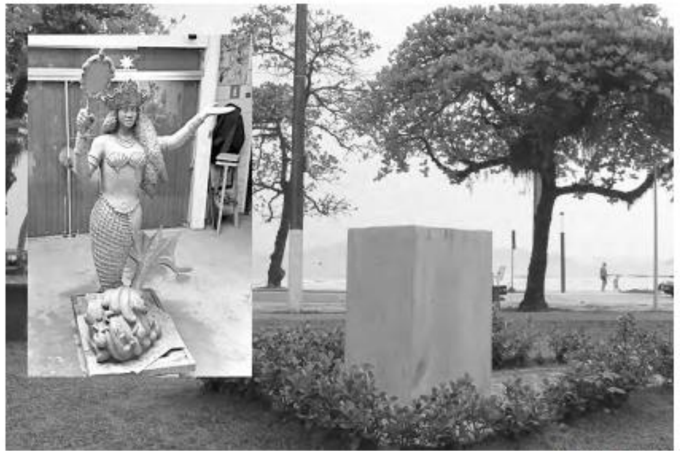
A imagem de Iemanjá, fornecida pelo escultor, está escondida no Teatro, enquanto pedestal está há cinco meses na orla aguardando