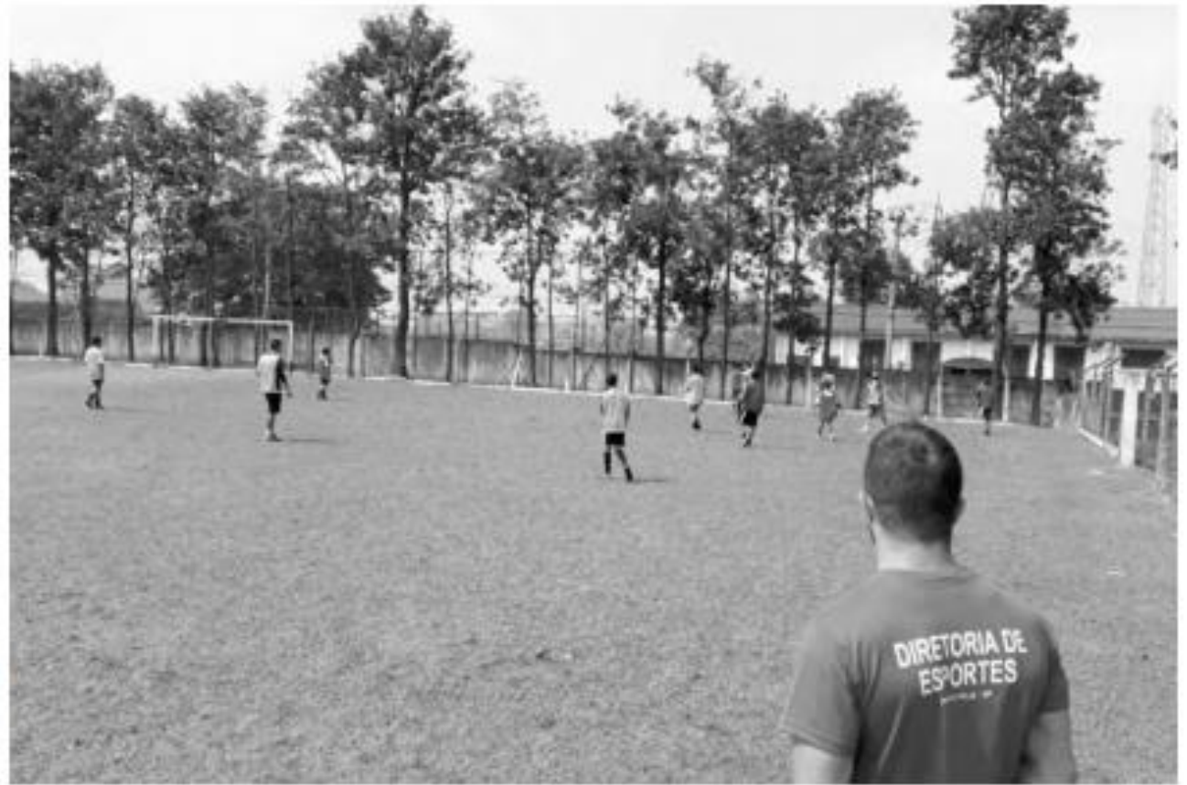
Mesmo após uma eventual reabertura ter sido permitida, escolinhas não poderão realizar partidas entre os alunos neste momento

Devido à recomendação de distanciamento social mínimo de dois metros, as partidas não seriam autorizadas mesmo com a reabertura das escolas e apenas os treinos individuais deverão ocorrer com o acompanha-