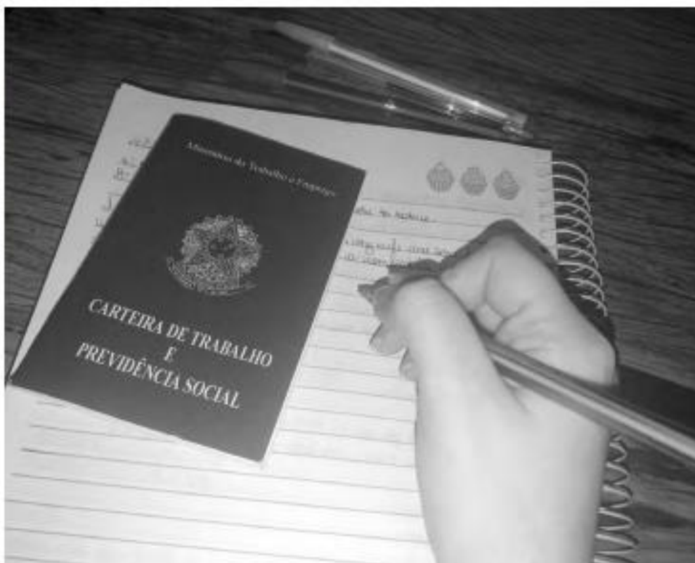
Projeto quer ajudar jovens a conseguir empregos e diminuir porcentagem de pessoas desocupadas

Vale lembrar que o artigo 60 da Lei nº 8.069 de 13 de Julho de 1990 da constituição federal prevê a completa e total proibição de qualquer trabalho a menores de quatorze anos de idade, salvo na condição de aprendiz.