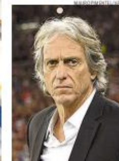
Técnico vai treinar o Benfica

O português Jorge Jesus deixa o Flamengo e volta ao Benfica, clube que já treinou entre 2009 e 2015. O técnico do Palmeiras, Vanderlei Luxemburgo, comentou a saída: "O treinador cismou de ir embora no meio do caminho. (...) se fosse brasileiro, seria porrada a todo momento". B-7