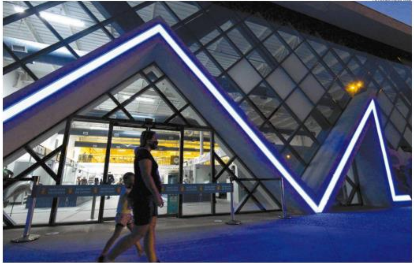
Novo espaço funciona na Avenida Mario Covas, em um terreno de quase 3,5 mil m 2 e em um prédio com 2.158,51 m 2 de área construída

Quem passou diante da obra percebeu o movimen-