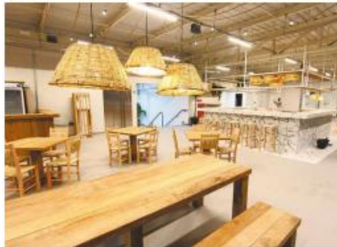
O local dispõe também de um restaurante de peixes e frutos do mar