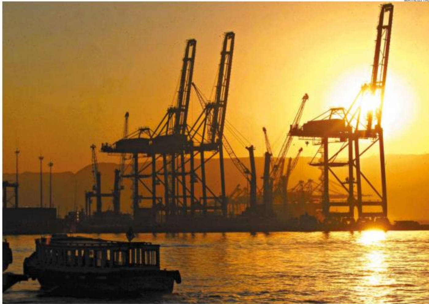
Um dos grupos do Condesan terá como tema Desenvolvimento Econômico; Cidade tem na atividade portuária um de seus pilares econômicos