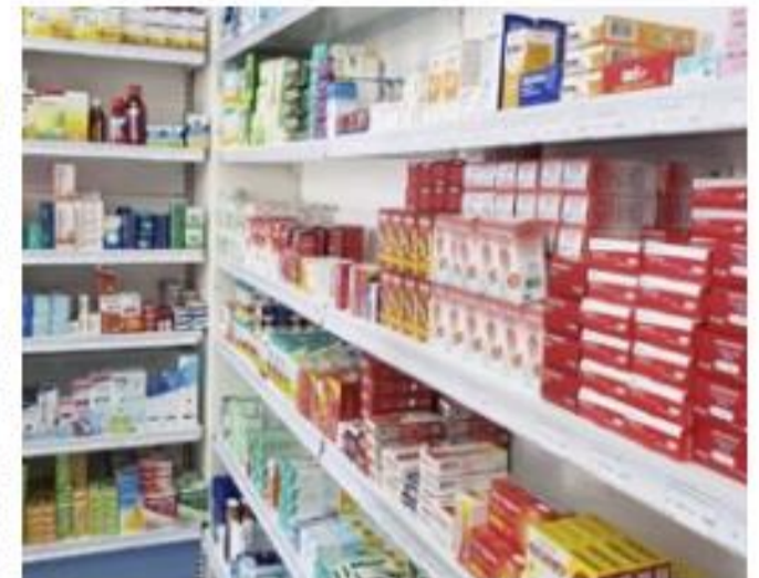
MAP BLENDDARIO DO LITORAL

O texto ainda afirma que o projeto de lei também padece de vício formal subjetivo de inconstitucionalidade porque a disposição dos serviços oferecidos à população, como a distribuição de medicamentos, cabe apenas ao poder Executivo uma vez que as leis tratam da