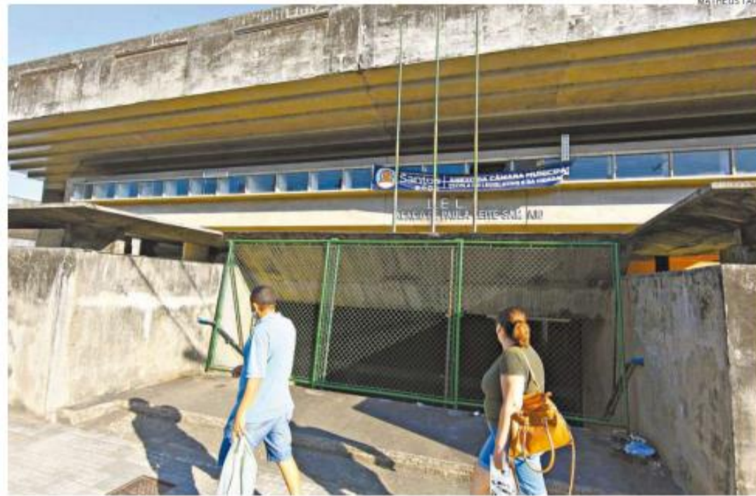
Intenção da Câmara é reformar a antiga escola Acácio e instalar os cursos gratuitos da Escola do Legislativo

de formação política, educação para a cidadania, difusão cultural, capacitação de