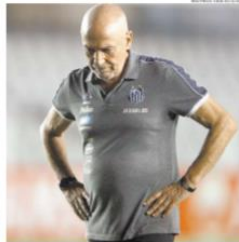
Ele comandou o Peixe em 15 jogos: 6 vitórias, 4 empates e 5 derrotas

do a Reportagem apurou, o Peixe terá que negociar o pagamento de aproximadamente R$ 7,3 milhões aos seis portugueses.