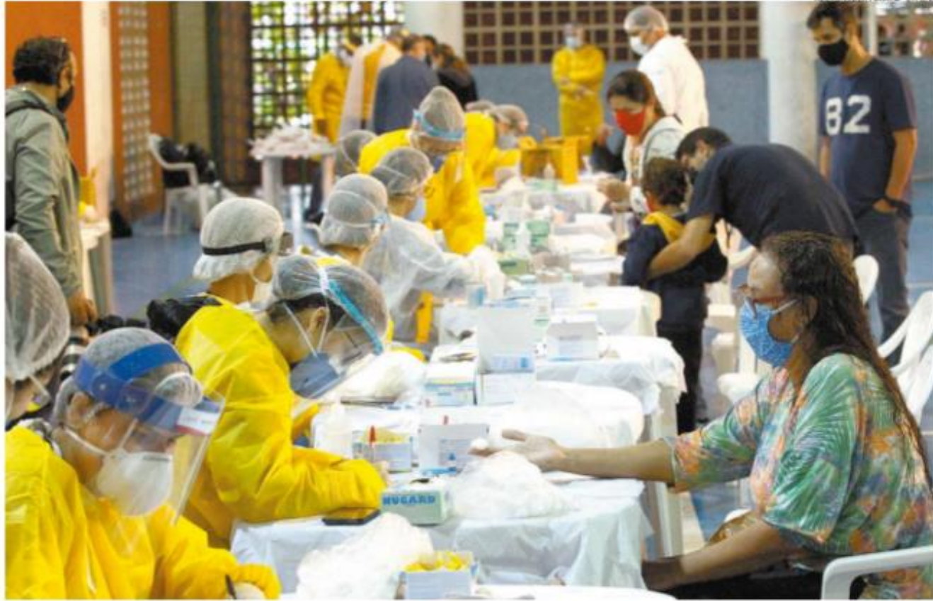
Dos 15.484 casos de coronavírus registrados até ontem na Cidade, confirmaram-se 4.323 por testes rápidos, sem necessidade de contraprova