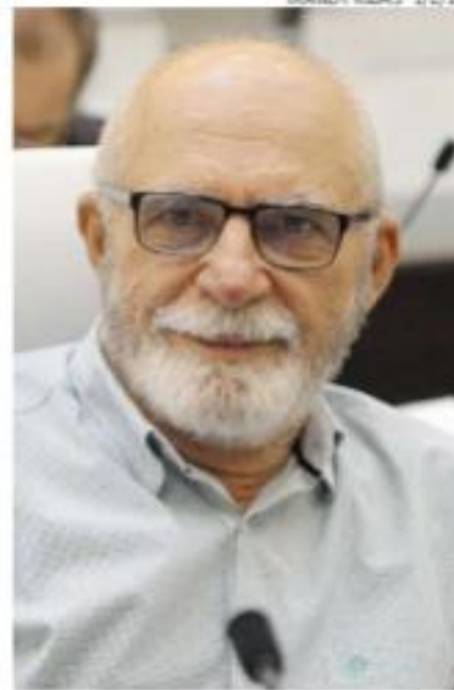
Furtado deu positivo em 1º teste

Já Santana frisou que os testes rápidos talvez não se-