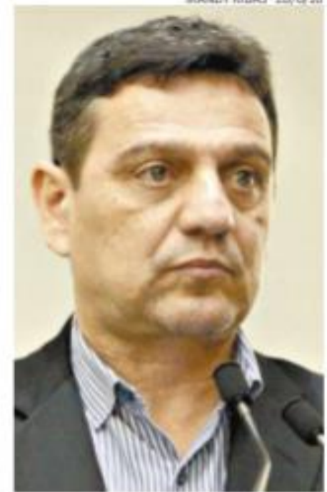
Santana soube resultado ontem

jam os melhores para detecção da covid-19, mas servem "para ao menos nortear uma pesquisa". "Assim que soube do resultado positivo no teste rápido, marquei o sorológico".