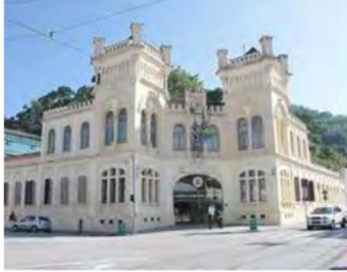
NAIR BUENO/DIÁRIO DO LITORAL

“Alterar o entendimento sobre as estatísticas demonstra