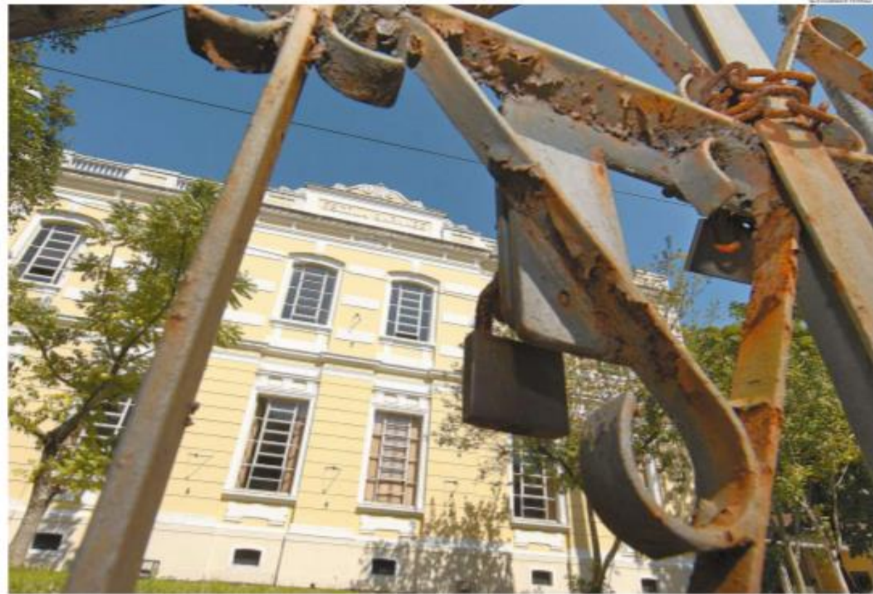
Uns emergem na volta um perigo à saúde pública, enquanto outros entendem que já é hora de retomar as atividades de forma presencial para minimizar riscos pedagógicos

O desembargador Eduardo Siqueira foi visto novamente desrespeitando o decreto de Santos. As imagens mostram o magistrado sem máscara na Praia do Embaré. Em julho, ele foi flagrado humilhando um agente da Guarda Civil Municipal. Agora, ao ser questionado, ele não negou que esteve no local e debochou dos guardas, alegando que "não dá bola" e que eles "poluam a praia". A-4