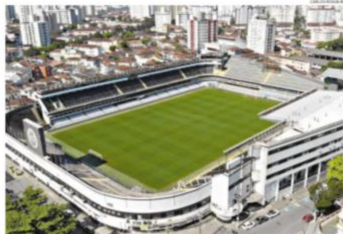
Santos joga contra o Red Bull Bragantino, na Vila Belmiro vazia, seguindo os protocolos contra a covid-19

mente, o objetivo do treinador é transformar as desconfianças em motivação, após o fraco desempenho da equipe no Campeonato Paulista, ainda com o português Jesualdo Ferreira no comando. B-9