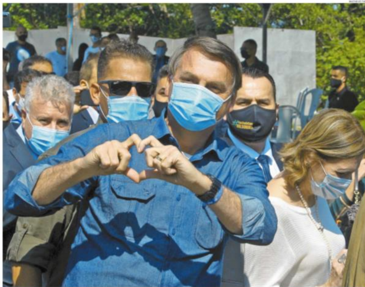
Integrantes do Governo, autoridades políticas regionais e apoiadores acompanharam o presidente na passagem por São Vicente: aos jornalistas, fez o sinal do coração com as mãos

É possível fazer um teste de covid-19 de graça na Baixada Santista. Mas há algumas condições: é preciso pelo menos estar com sintomas de gripe (ou ter se recuperado). O exame RT-PCR é o melhor para o diagnóstico. Em todas as cidades, é necessário ter pedido médico para que o paciente faça esse exame. A Tribuna traz um guia com o esquema de testes em cada município. A-7