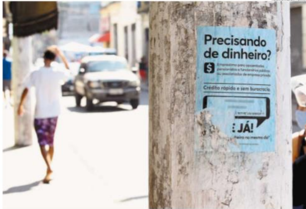
Intenção da Câmara dos Vereadores de Santos ao aprovar a medida é diminuir a poluição visual na Cidade

"A legislação já existia. Foi uma lei complementar, que impõe multa direta ao infrator", explica o vereador. Pela regra anterior, primeiro o Município solicitava a quem infringisse a lei que retirasse o material em