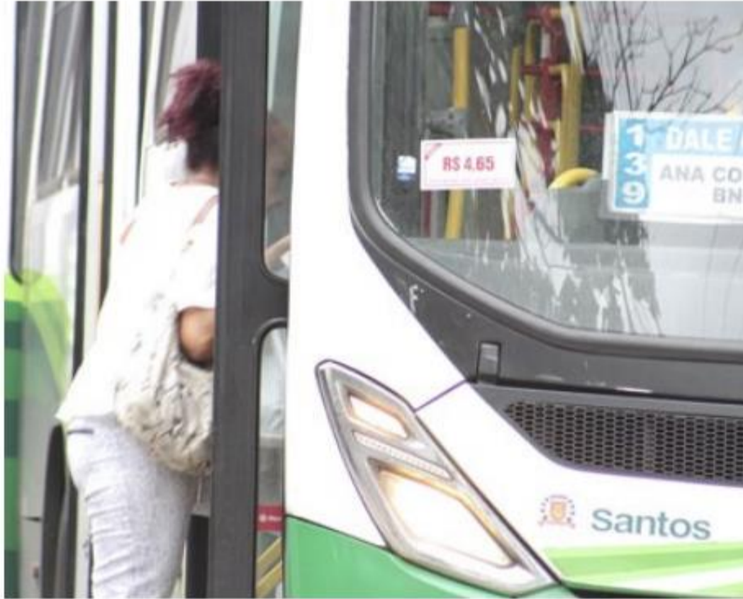
Falta de dispensers e lotação em ônibus de Santos foram argumentos de vereador em denúncia

"Diariamente pessoas postam nas redes sociais