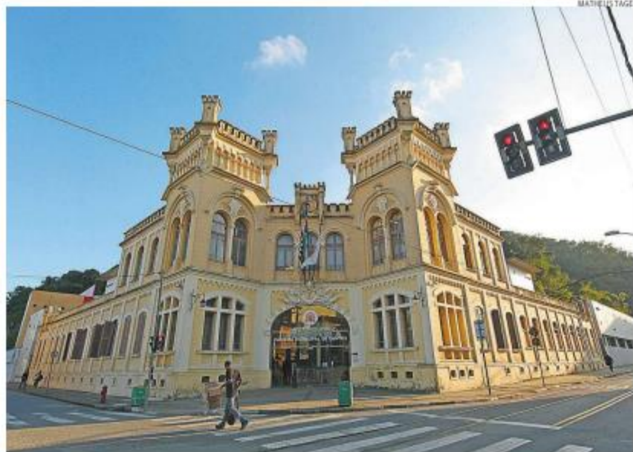
PL terá parecer votado hoje; depois, segue para outras comissões e ainda não tem prazo para aprovação

“Essa punição será uma forma de proteção dos direi-