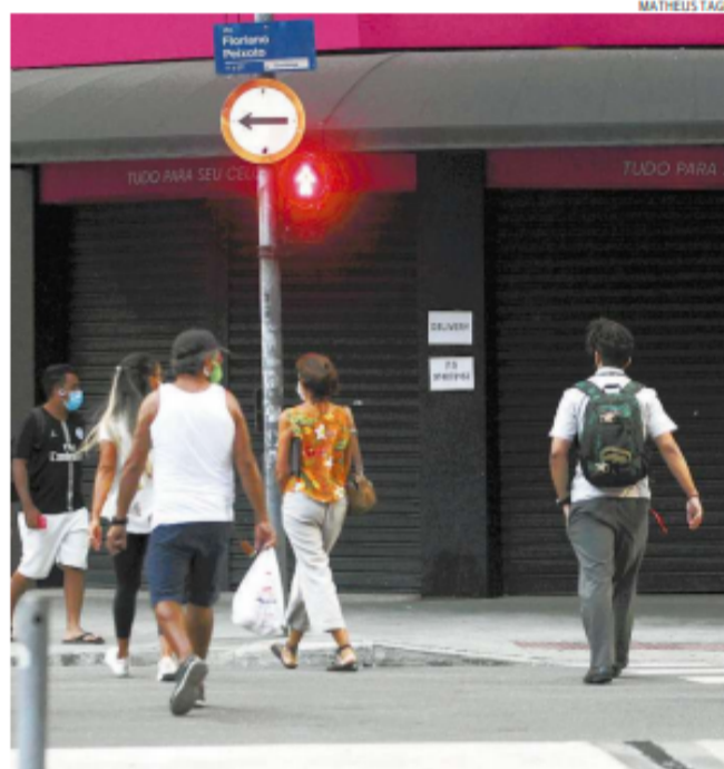
Na Baixada Santista, média de mortes cresceu 57,14% nesta semana

Também foram confirmadas quatro mortes em São Vicente, que chega a 605 óbitos; dois em Praia Grande, que agora soma 401 mortos; um em Peruibe, que soma 85 mortes; e mais um em Guarujá, que completa 611 mortes.