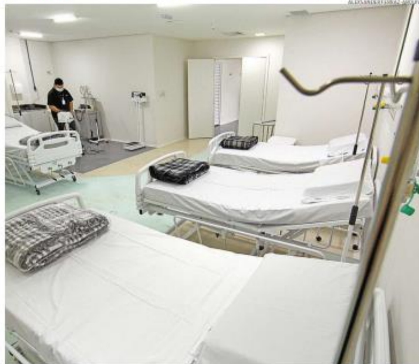
Um dos locais que podem receber ampliação é o hospital de campanha Vitória, com mais 20 leitos UTI

Segundo ele, já está em análise a contratação de profissionais, ampliação de equipamentos de respiração e toda a parte logística