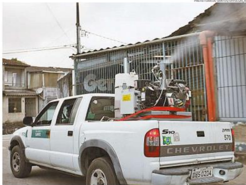
Os moradores não precisam deixar as residências para a aplicação do inseticida por meio dos fumacês