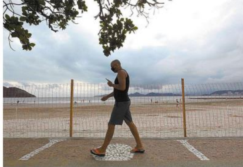
Acesso à faixa de areia em Santos foi proibido pela Prefeitura desde sábado a fim de evitar aglomerações

Restaurantes e bares só poderão atender por delivery ou drive thru (passando com veículo para retirada). As pessoas não podem ser recebidas dentro desses estabelecimentos, sob pena de multas. Escritórios e setores administrativos públicos ou privados deverão manter as equipes em home office.