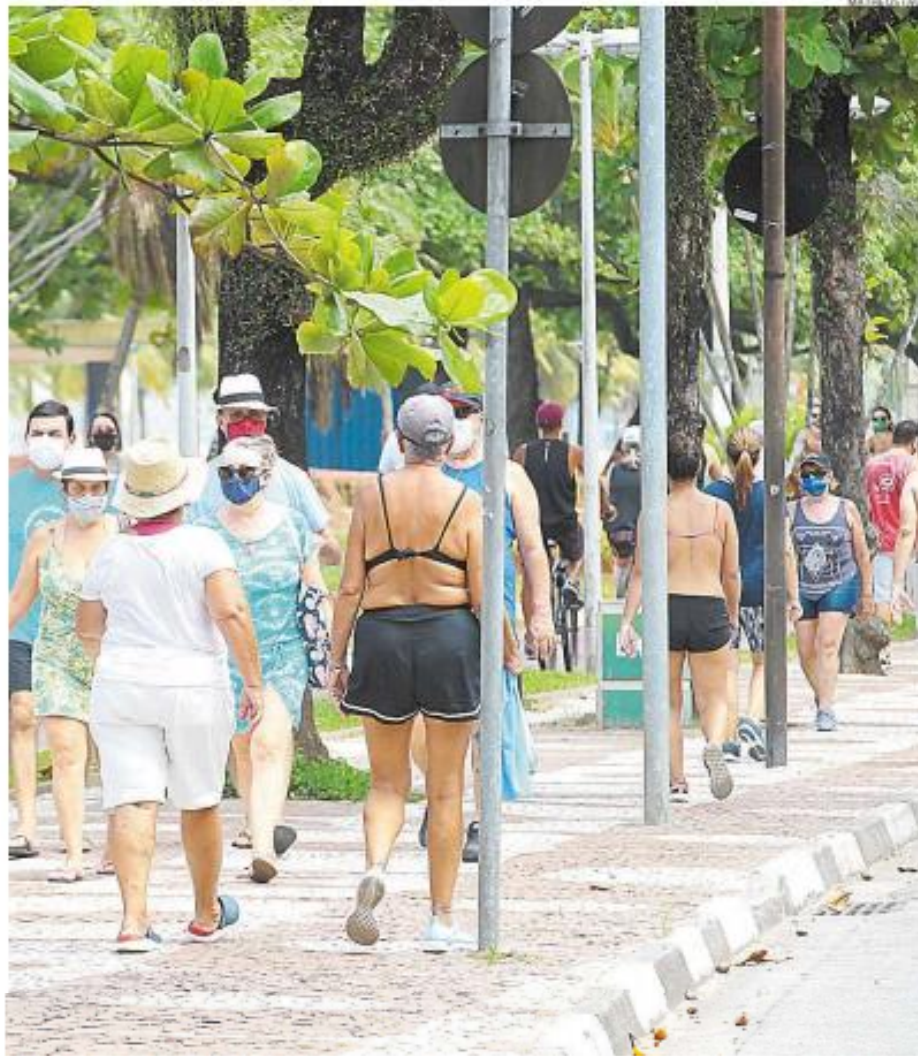
Calçadão da orla santista ficou lotado ontem, mesmo com orientação para que as pessoas fiquem em casa

Haverá, ainda, segundo Rogério, uma força-tarefa para impedir aglomeração dentro do transporte público, com Guarda Municipal e agentes sanitários. O prefeito também disse que, a partir de amanhã, lojas de conveniência de postos não poderão mais funcionar, as-