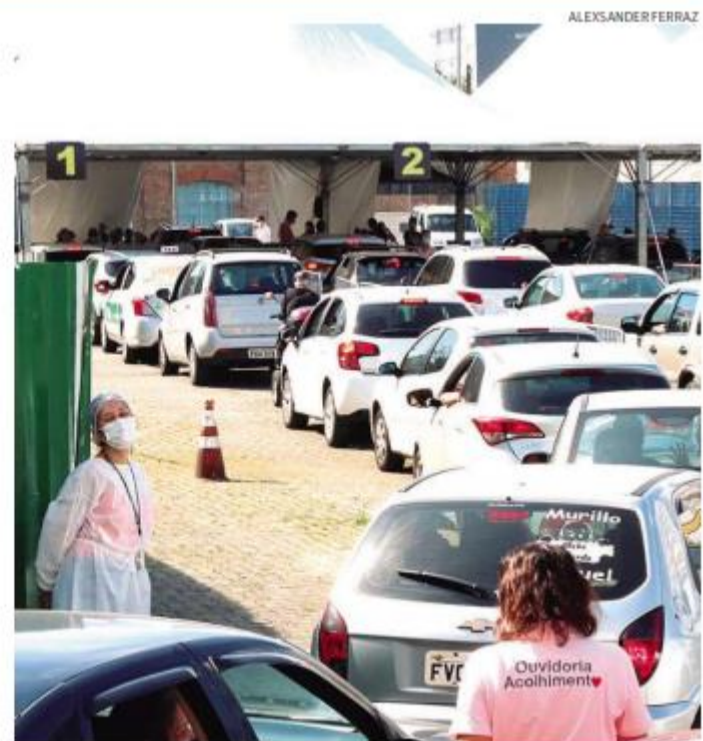
O drive thru volta a funcionar hoje na Arena Santos, a partir de 9h

quem tem mais de 60 anos em terras vicentinas. Hoje, os idosos com 62 anos serão imunizados contra a covid-19, em Bertioga. Já Cubatão vacinará pessoas entre 60 e 62 anos a partir de amanhã. Em Peruíbe, quem tem 62 anos poderá se vacinar na sexta. Itanhaém, por sua vez, ainda cadastra idosos entre 63 e 64 anos para imunizar.