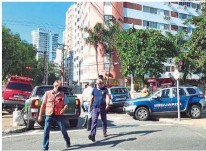
Equipes de diversos órgãos públicos estiveram no local do vazamento

A estimativa é que aproximadamente 2 mil litros de óleo tenham se alastrado pelas galerias de águas pluviais da Cidade, desembocando no Canal 6. De acordo com o Carrefour, em nota, foi identificado um problema na mangueira do tanque de óleo que alimenta o