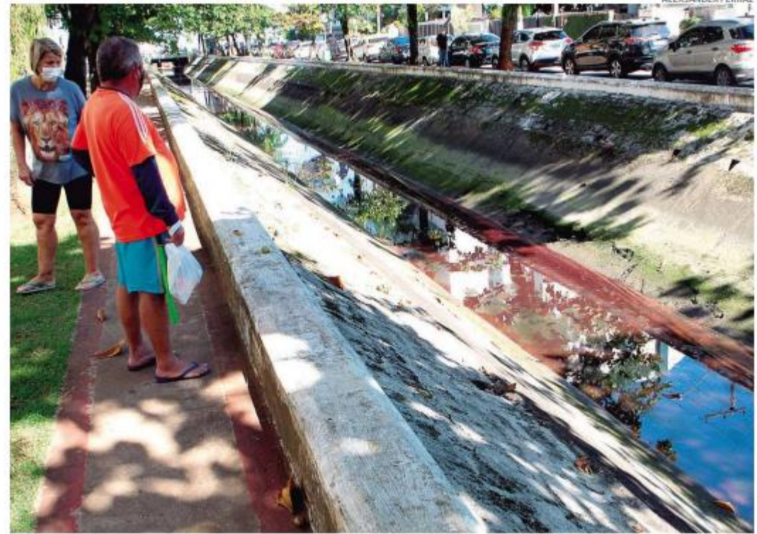
Mancha avermelhada no Canal 6 chamou atenção, assim como um cheiro similar ao de querosene

rias municipais de Meio Ambiente e Serviços Públicos, Defesa Civil de Santos, Corpo de Bombeiros, Guarda Civil Municipal, os órgãos ambientais Ibama e Cetesb e a Autoridade Portuária de Santos (APS).