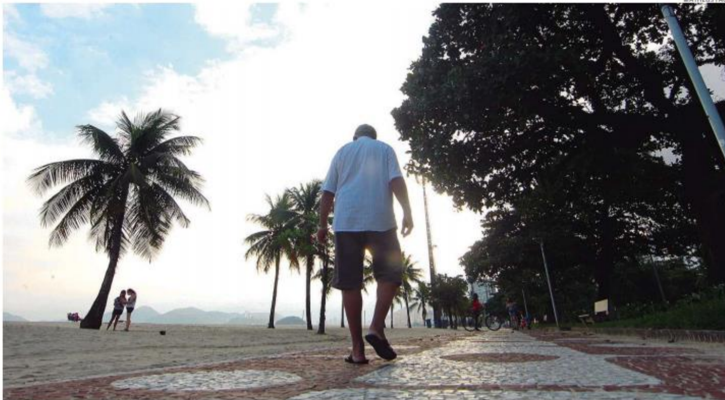
Autoridades santistas destacam os efeitos da vacinação contra o novo coronavírus na parcela mais idosa da população nos últimos meses

Ele explica que chegaram a ser aplicadas mais de 10 mil vacinas nesta faixa etária, envolvendo mais de 30 postos e todo o efetivo da atenção básica. “A imunização é fundamental para que as pessoas possam ter mais segurança e possamos retomar a vida sem qualquer problema”.