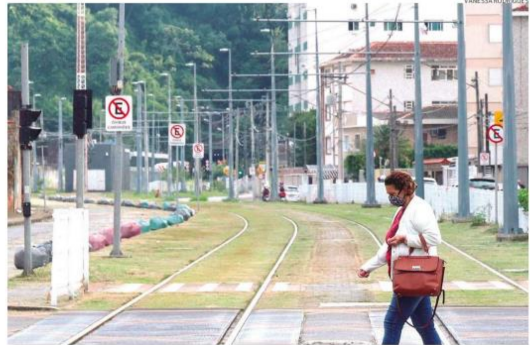
Moradores dizem que o trecho entre as ruas Gaspar Ricardo e Guilherme Álvaro é alvo de criminosos

A Prefeitura diz que combater e investigar crimes cabem às polícias, que têm apoio da Guarda Civil Municipal sempre que solicitado. A Polícia Militar pode ser acionada pelo telefone 190, e a Guarda, pelo 153.