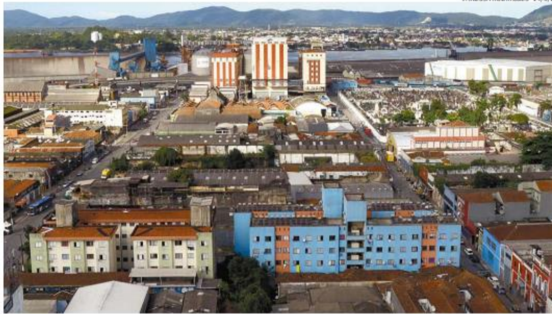
VANESSA RODRIGUES - 14/5/21

Hoje, diz ele, a área central é pouco movimentada de dia e deserta à noite, sem contar os imóveis antigos degradados, parte deles tombados pelo patrimônio histórico. “Para que este quadro se reverta, o caminho é reativar as habitações