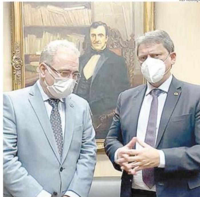
Ao lado de Marcelo Queiroga, Tarcísio anunciou entrega de vacinas

A quantidade leva em conta os trabalhadores portuários avulsos vinculados ao Órgão Gestor de Mão de Obra (Ogmo), profissionais que atuam em terminais e em órgãos federais que atuam nos portos. Todos têm menos de 60 anos e não têm comorbidades.