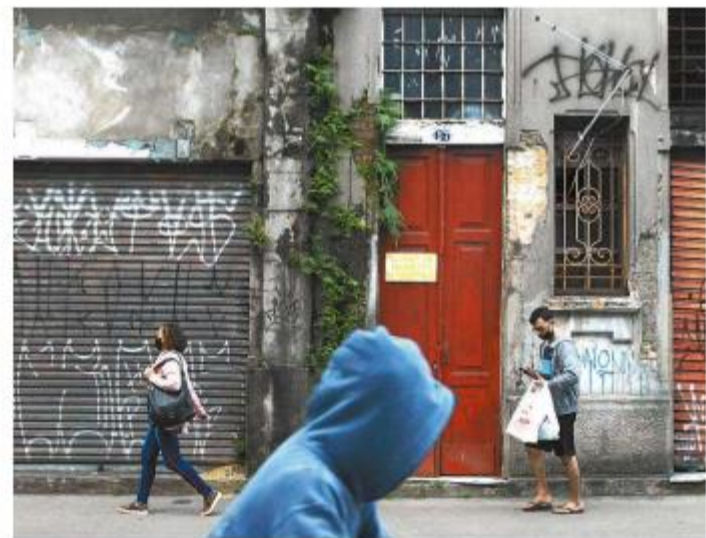
Baixada registrou 458 novos casos de coronavírus em período de 24h