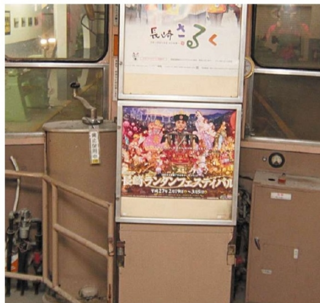
O bonde, com 34 lugares, ainda está com alguns cartazes em japonês no console; as cores originais serão mantidas após o restauro