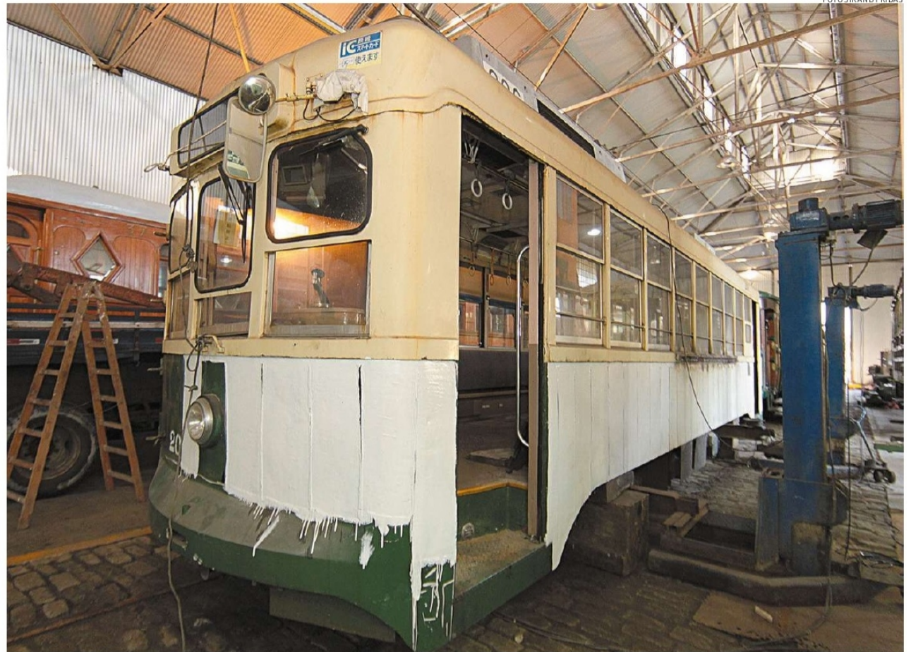
O bonde está passando pelo processo de restauro no galpão, no Valongo; no momento, as rodas estão sendo adaptadas para os trilhos daqui

“Não é um processo simples. Começamos a fazer a avaliação técnica em 2016, para ver quais seriam os reparos necessários. Só depois tivemos a chance de ver a questão financeira que foi fechada em cerca de R$ 150 mil. Nesta etapa, resolvemos recorrer a verba, mas para isso precisamos montar projetos e o órgão tinha que aprovar. O processo demorou bastan-