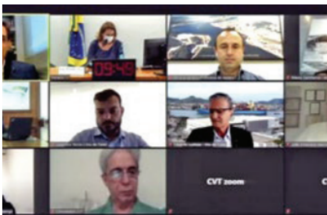
As autoridades participaram da reunião por videoconferência

valho, executivo de Mercado e Infraestrutura, mostrou as vantagens do túnel e destacou que o modelo proposto pelo Estado de viabilização da ponte faria os usuários do sistema Anchieta-Imigrantes pagarem pela obra, enquanto que o túnel seria custeado apenas pelos que venham a