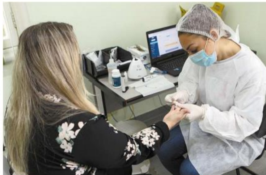
Profissionais que trabalham na unidade fizeram testes; até sexta, as aulas serão exclusivamente remotas