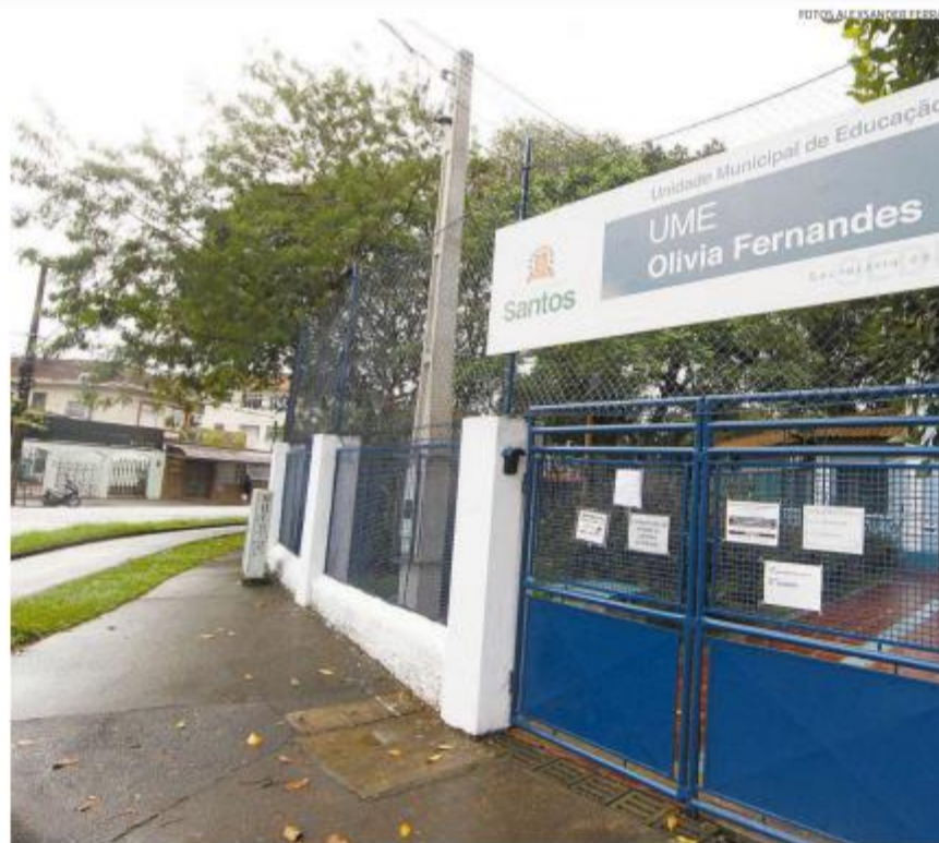
Na UME Olívia Maria Fernandes, diretora e professora tiveram covid confirmada após morte de funcionária

A partir de 14 de junho, a previsão é de que o atendimento escolar volte a ser híbrido na unidade, com máximo de 35% de atendimento presencial, com os protocolos sanitários.