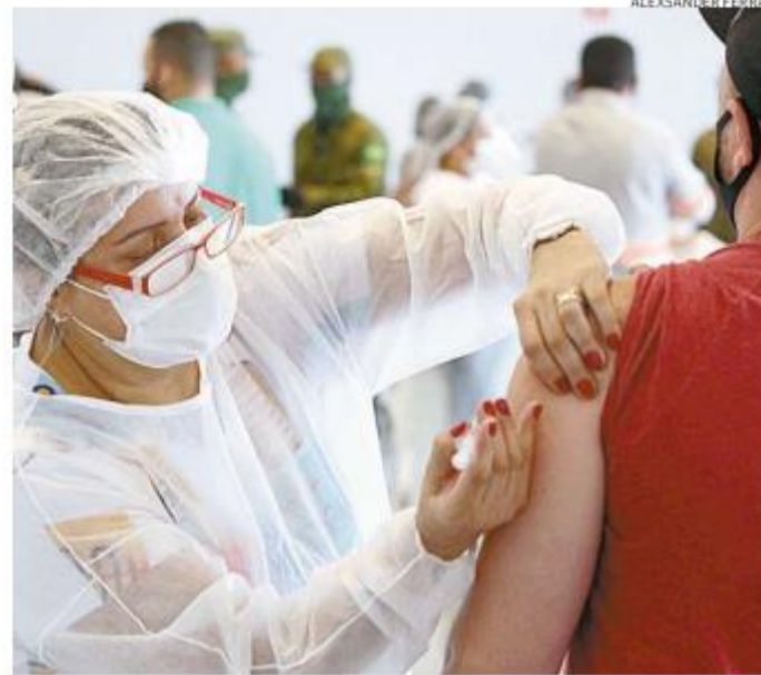
Trabalhadores do Ogmo são vacinados no Santos Convention Center

Para os que atuam na Autoridade Portuária de Santos, o imunizante continua disponível em um posto na