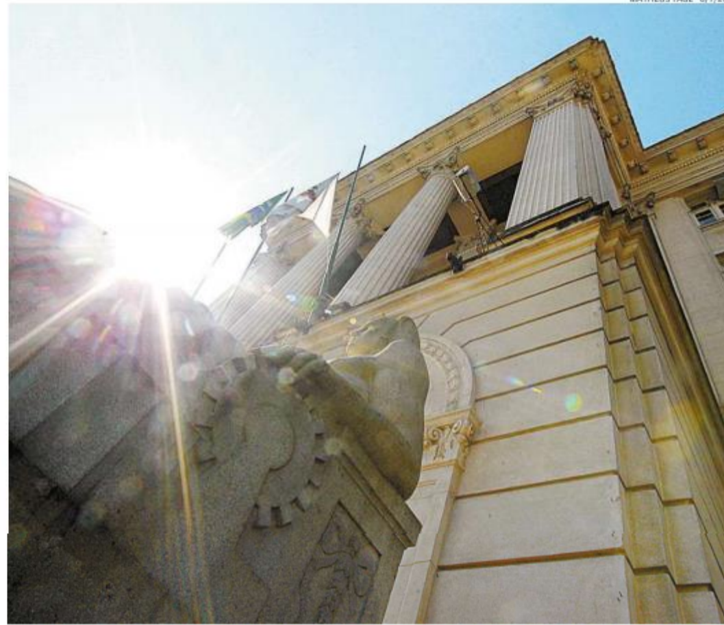
Segundo a Lei de Diretrizes Orçamentárias, a Prefeitura terá um orçamento de R$ 3,284 bilhões em 2022