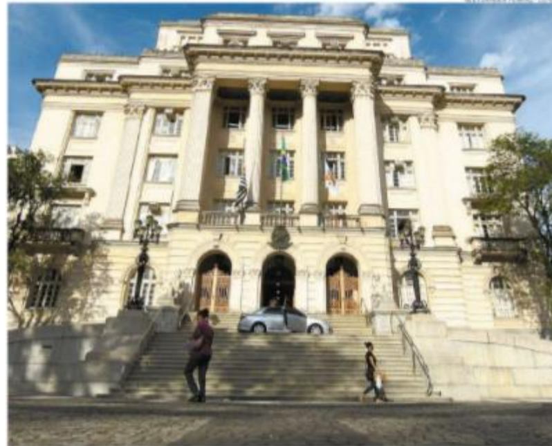
O servidor deverá cumprir exigências para receber o adicional, como especialização na área em que atua

sis a alteração nos critérios do adicional de gestão pública a ser concedido ao funcionário estável, no valor mensal de R$ 1.569,46. Ele seguirá com caráter transitório e pago apenas enquanto perdurar o programa ou projeto de interesse da Prefeitura, limitado a 24 meses.