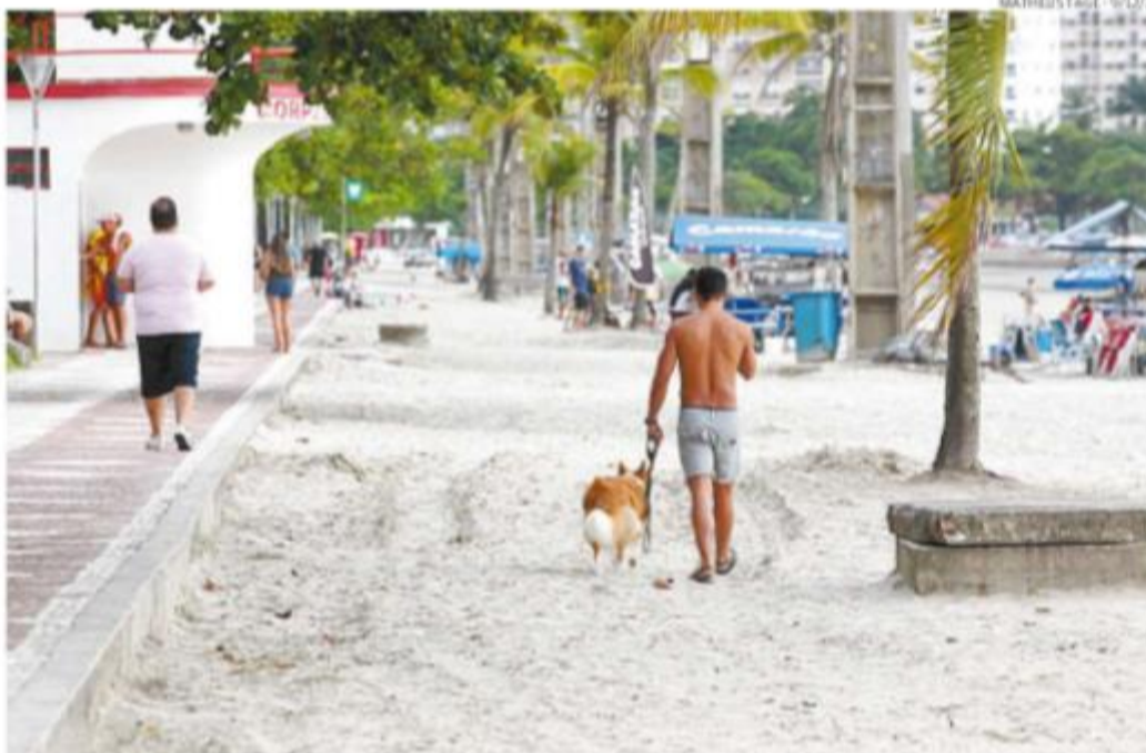
Em diversas ocasiões é possível observar donos levando seus animais de estimação para andar na praia

“Se, numa situação dessa, o animal estiver com ancylostoma (verme intestinal), defecar na areia e nada for recolhido, pode dar origem ao bicho geográfico, a partir da larva do ancylostoma”.