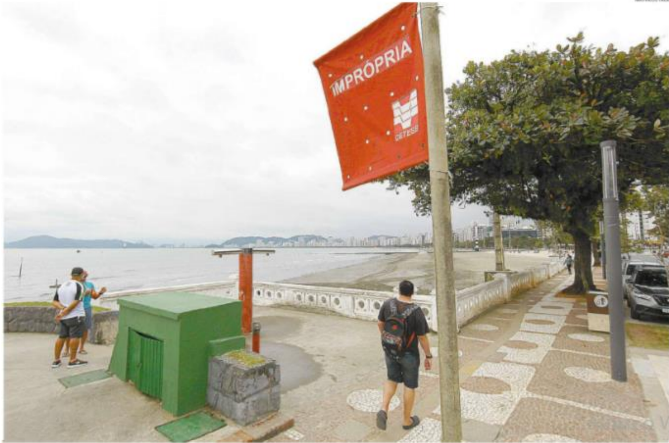
A pior contagem ocorreu em Santos, onde cinco praias tiveram classificação péssima e duas ruins; apesar disso, houve melhora em relação a 2019, com menos coliformes fecais

Já em Santos, os canais recebem uma carga de poluição fecal relativamente