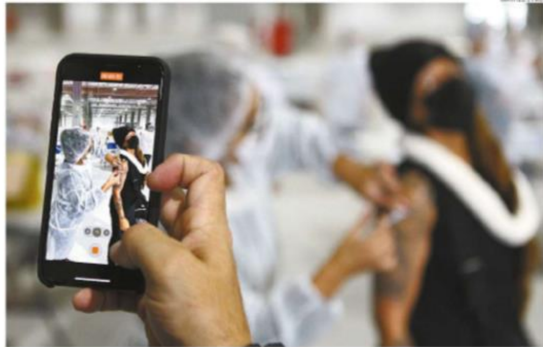
Quem tem ido aos postos de imunização, como o Santos Convention Center, aproveita para registrar a vacinação

Pelo cronograma de vacinação do Governo do Estado, as pessoas de 42 anos seriam vacinadas só a partir do próximo dia 30. Mas, com a novidade em terras santistas, 31 postos estarão disponíveis para esta faixa etária, sendo 22 policlínicas, das 8h às 13h, oito postos externos, das 8h às 16h, e o Santos Convention Cen-