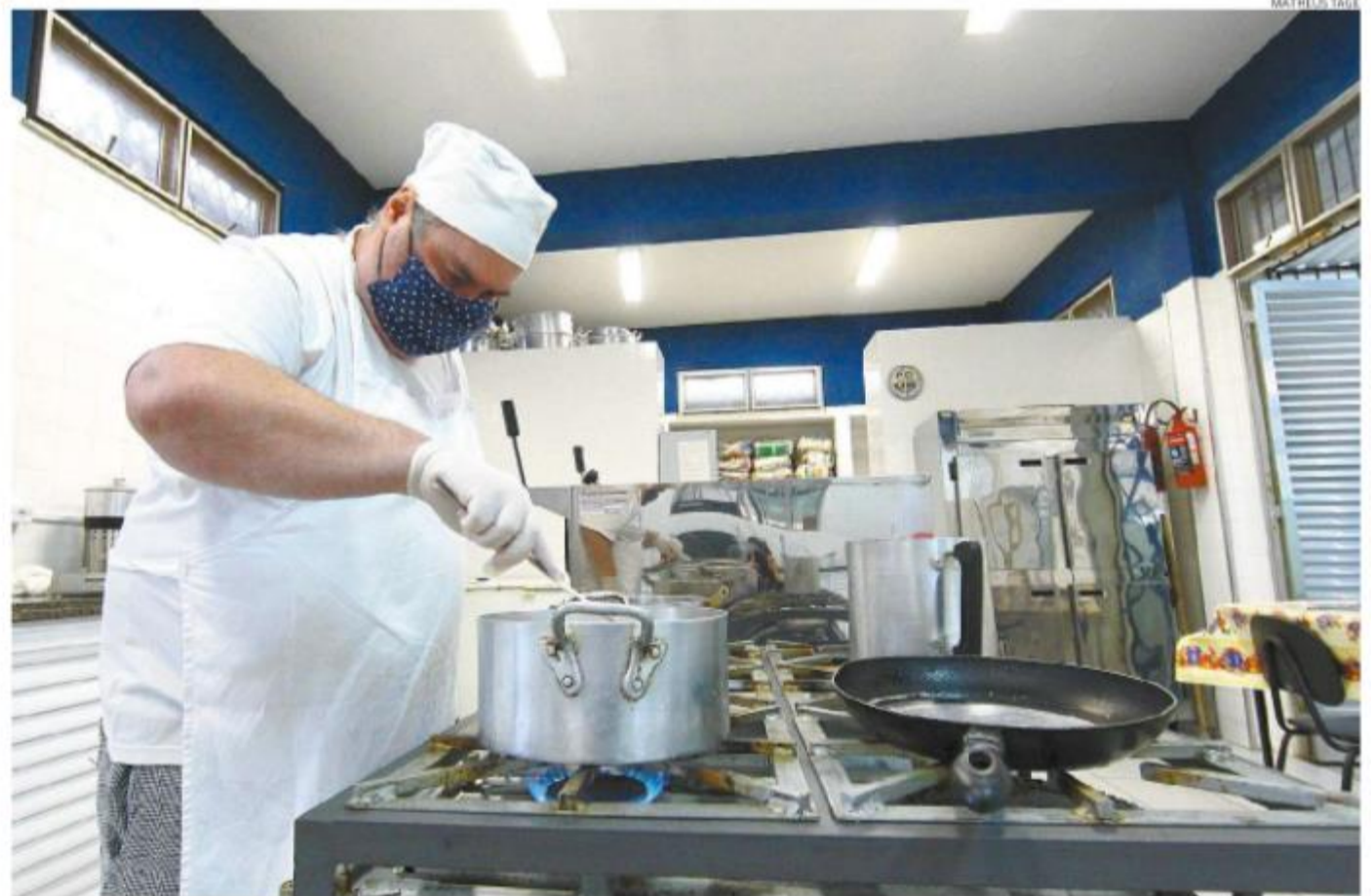
Cozinha da UME Magali Alonso, no Morro São Bento: número de escolas com orgânicos dependerá da disponibilidade dos produtores