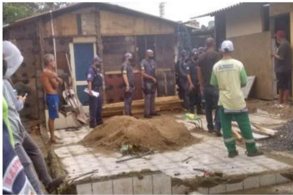
Reintegração ocorreu sem aviso. Crianças, idosos e pessoas com comorbidade sob frio e pandemia

vamento crise econômica por conta a sanitária, as ocupações têm aumentado. "Isso eu tenho sentido na Bela Vista (Morro) e no Dique. No São Manoel, tem casas de alguns meses e outras que chegam a um ano de erguidas. Não houve ordem judicial, foi um despejo administrativo",