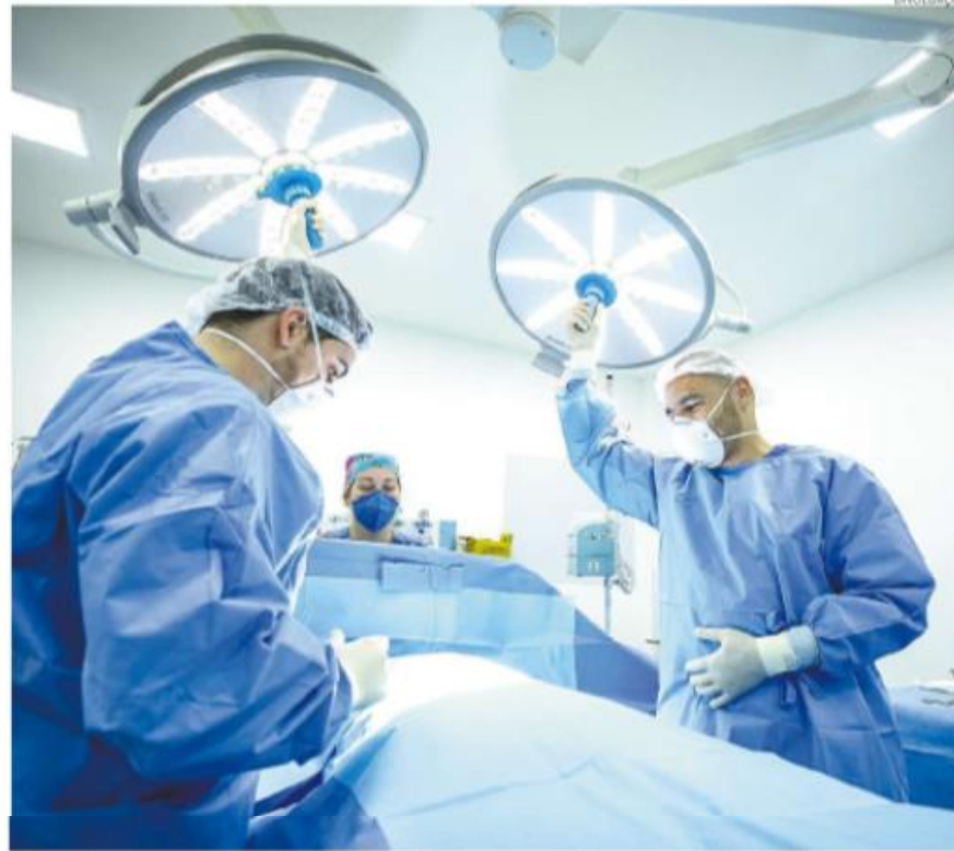
A diretoria da Santa Casa ressalta que os novos equipamentos dão mais segurança a médicos e pacientes