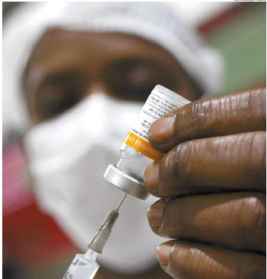
Em toda a região, já foram aplicadas 919.729 doses de três vacinas: CoronaVac, Pfizer e Oxford/AstraZeneca

Praia Grande confirmou mais sete mortes e chega a 812. São Vicente e Guarujá também registraram cinco óbitos cada. Também foram divulgadas mortes em Bertioga, com três ocorrências, e Peruíbe, com uma vida perdida.