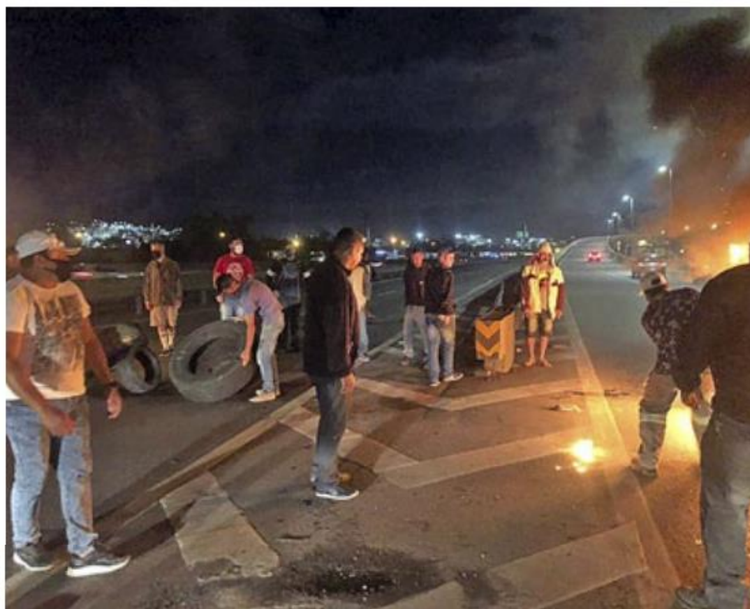
Moradores seguiram até a entrada da Cidade para mostrar indignação com a atitude da Prefeitura