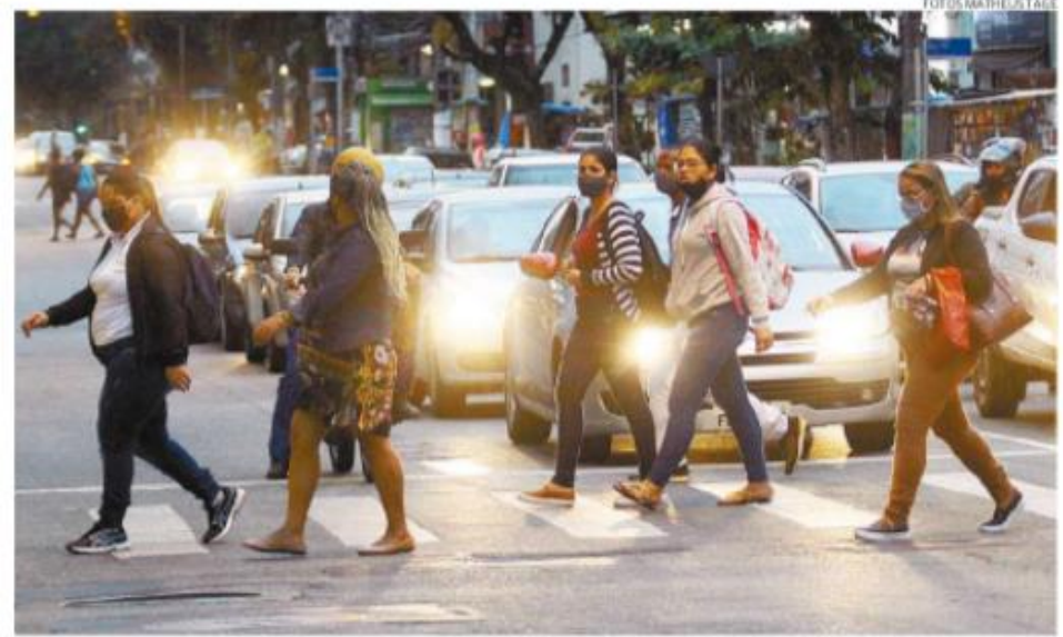
Com mutações do novo coronavírus, a transmissão se torna mais rápida e o controle da doença fica pior