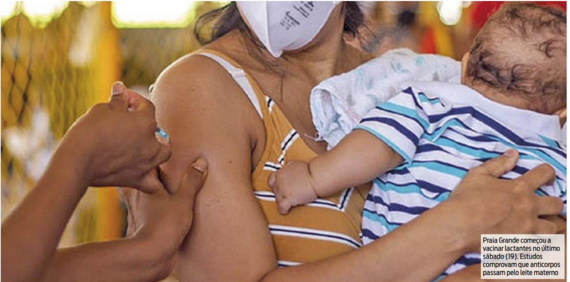
Praia Grande começou a vacinar lactantes no último sábado (19). Estudos comprovam que anticorpos passam pelo leite materno