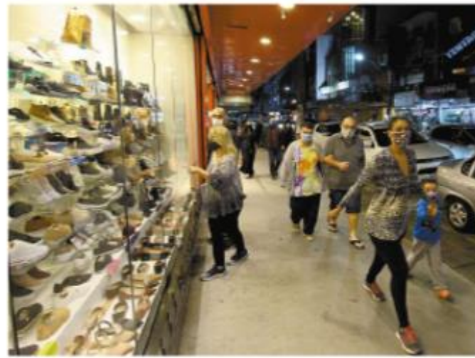
O comércio pode funcionar das 6h às 21h, com 40% da capacidade

No entanto, os municípios podem adotar medidas mais restritivas, se necessário, segundo o coordenador do Centro de Contingência da Covid-19, Paulo Menezes. Foi o que fizeram, por exemplo, 100 cidades paulistas últimos dias. No Interior, Araraquara de-