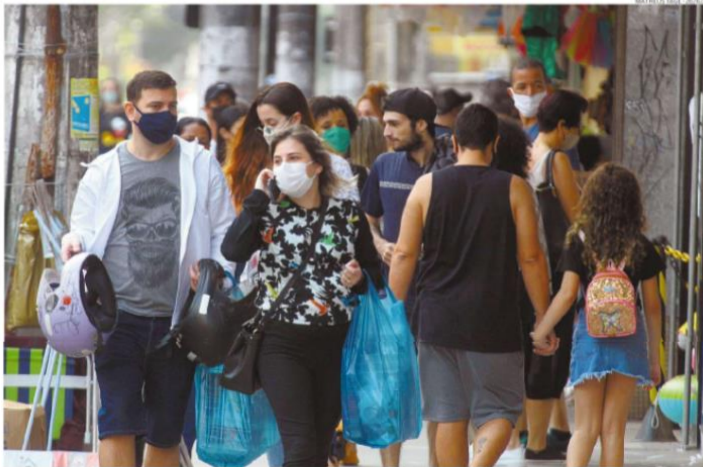
Entre os diversos indicadores positivos envolvendo a covid-19 em Santos, está a queda de 43,55% em novos casos da doença em sete dias

Em 24h, a Baixada Santista confirmou 34 mortes por