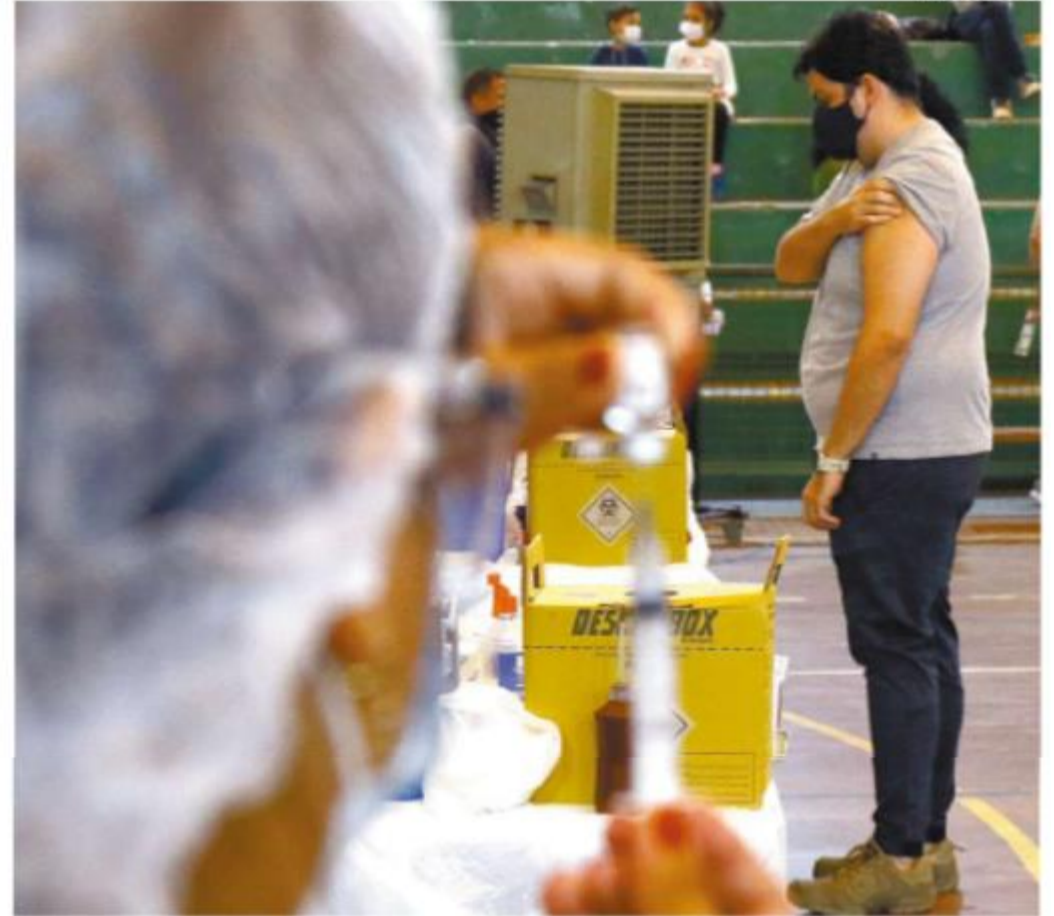
Nas últimas semanas, cidades da região vêm antecipando a convocação para a distribuição da 1ª dose

Tanto os médicos como as administrações municipais atribuem o resultado ao fato de haver uma população mais idosa, que no começo da imunização recebeu aplicações de CoronaVac, do Instituto Butantan, que tem intervalo entre as doses de 14 a 28 dias.