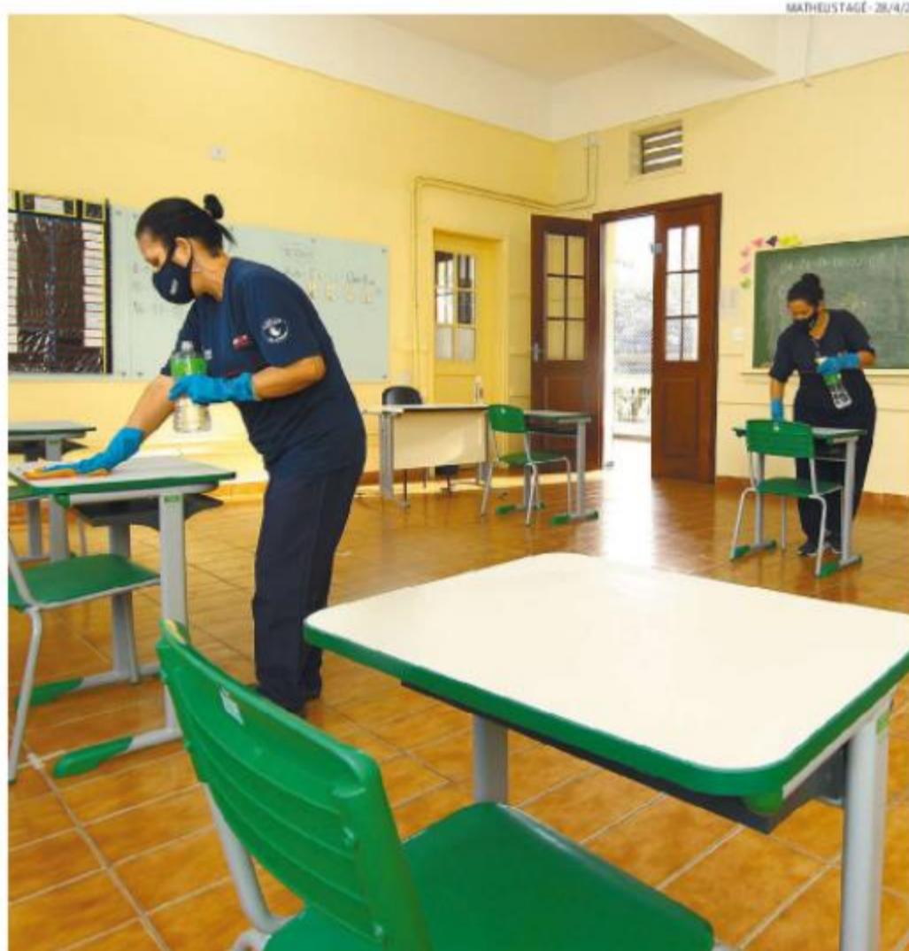
Para receber os alunos, escolas da rede pública de toda a região são submetidas a protocolos sanitários

Um modelo diferente do adotado por Bertioga, onde as aulas presenciais foram