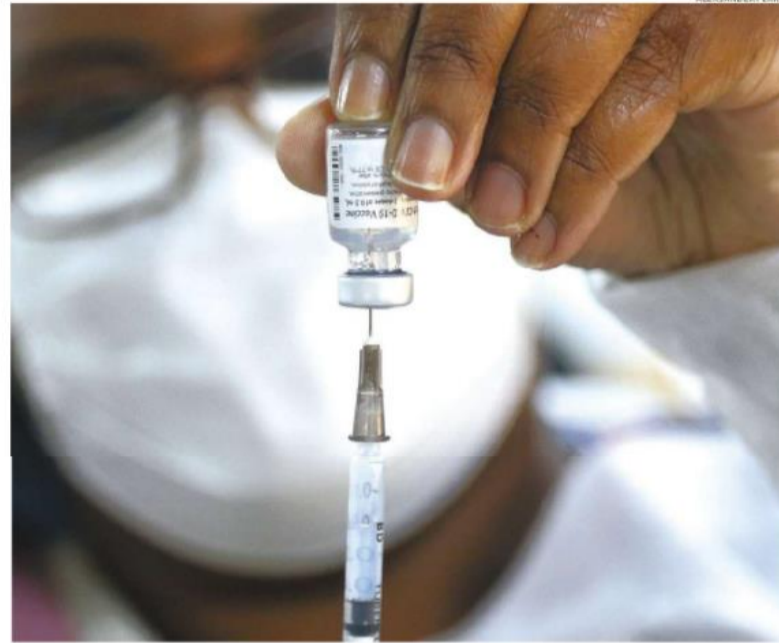
Governo de São Paulo voltou a frisar que o envio de doses é feito de acordo com o calendário estadual

Em nota, o Estado frisa que, após o envio, "é responsabilidade das prefeituras receber as doses e abastecer suas redes para continuidade da imunização". Destaca, ainda, que o Plano Estadual de Imunização (PEI) "envia doses suficientes para o público-alvo e em tem-