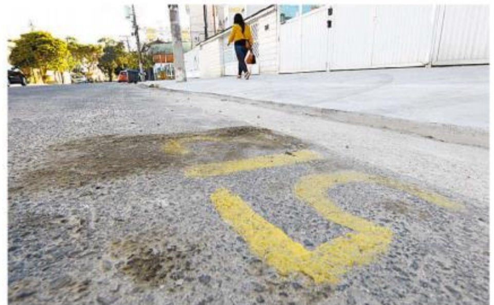
Demarcação de áreas para barracas começou. Prefeitura afirma que é para analisar viabilidade da ideia