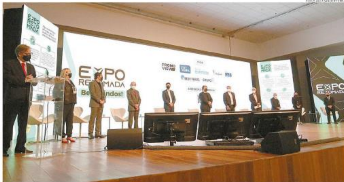
Com regras de distanciamento e outros protocolos, a Expo Retomada será finalizada hoje, no Santos Convention Center, na Ponta da Praia

A declaração de Lummertz serviu como um complemento à fala da secretária de Estado do Desenvolvi-