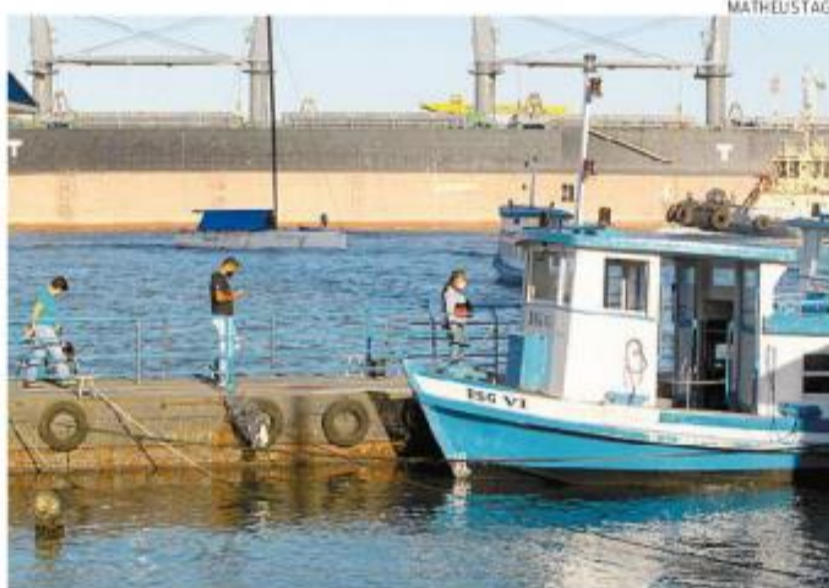
Tarifa nas lanchas Santos-Guarujá, porém, aumentou para R$ 4,00

Mesmo sem os reajustes, a Secretaria de Logística e Transportes de São Paulo afirma investir no sistema. Desde 2019, reformaram-se 11 embarcações e se introduziu um sistema de manutenção 24 horas.