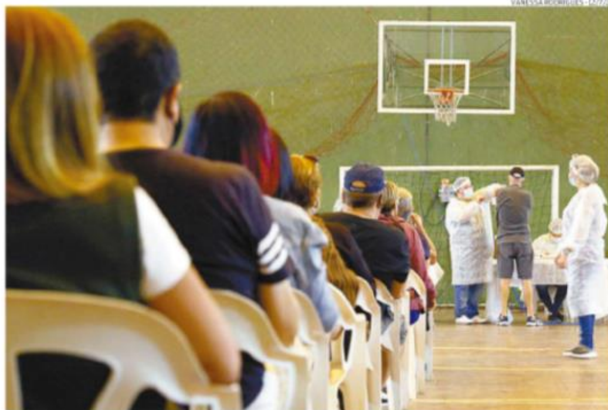
Cidade abre hoje 22 policlínicas e oito postos externos e pede doações de mantimentos a quem for se vacinar

Para garantir a dose, basta ir a uma de 22 policlínicas, das 8 às 13 horas, ou a um