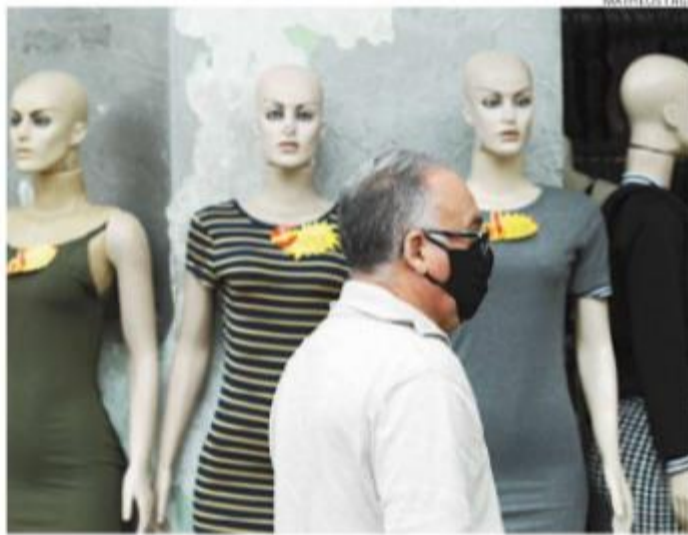
Comerciantes lutam para diminuir prejuízos provocados pela pandemia