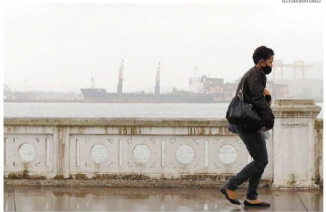
Instituto Nacional de Meteorologia também publicou aviso de perigo em potencial na Baixada Santista

partir de amanhã, chegando a 53,7 km/h. O mar continuará agitado, com